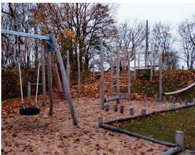
Inspiration til den fremtidige gårdhave

Områderne omkring porte, cykler og renovation vil blive belyst med belysningsarmaturer, som aktiveres ved bevægelsescensor. Der monteres LED lyskilder i alle belysningsarmaturerne, der tilsluttes fællesmåler.