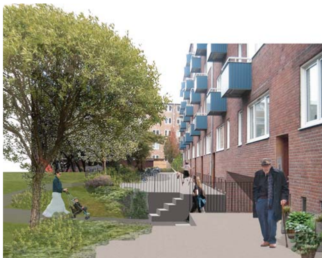
Inspiration til den fremtidige gårdhave