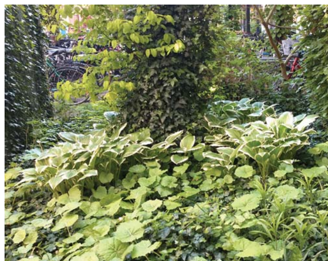
Inspiration til den fremtidige gårdhave