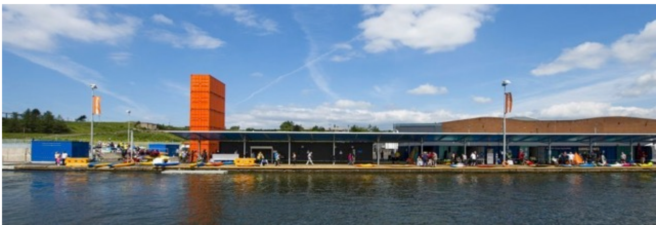
Foto: Klubfaciliteter og depoter på Pinkston Watersports i tæt kontakt til vandet.

Der vil være behov for nye klubfaciliteter, kontorfaciliteter og depoter, der kan være med til at understøtte aktiviteterne på anlægget og i Københavns Havn.