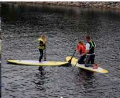
Flatwater Stand Up Paddle