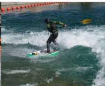
Stand Up Paddle White Water