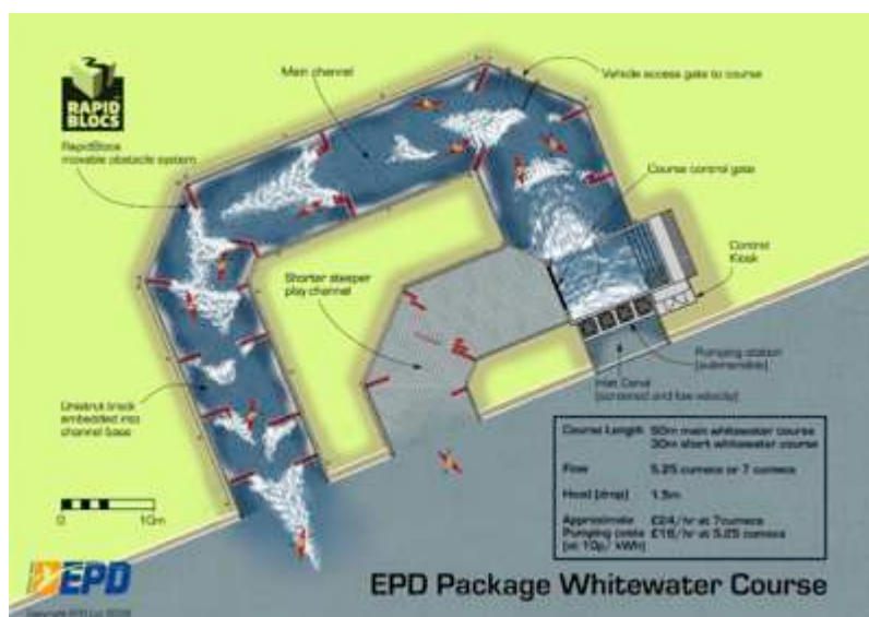
Visualisering: Skitsemodel af den tekniske opbygning af den kunstige white water og surf kanal.

Copenhagen Water Water Park vil være en videreudvikling af anlægget i Glasgow, og vil bl.a. udbygges med en surf kanal. Herudover vil der skulle arbejdes mere med at integrere anlægget ift. den omkringliggende by, med fokus på et højere arkitektonisk udtryk, så at CWWP også opleves som en inviterende og åben offentlig park som alle kan få adgang til.