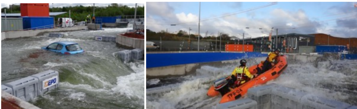
Foto: Anlægget i brug til redningstræning for livredderhold.

Dansk Surf & Rafting Forbund formidler redningstræning, sikkerhed og livredning i strømmende vand, og vil via Copenhagen White Water Park formidle forbundets egne redningskurser og uddannelsessystem, samt et internationalt anerkendt redningssystem Rescue 3 International.