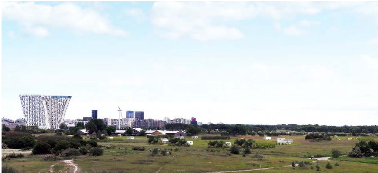
Figur 2: Visualisering af området hvor campingpladsen skal placeres.