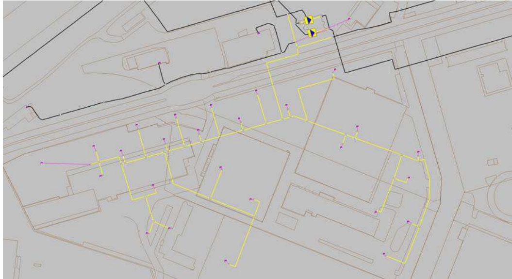
Figur 3 Udbygget ledningsnet for Frederiks Brygge

placering bliver endelige. Ud over gadeledningen skal der etableres stikledninger ind til hver bygning.