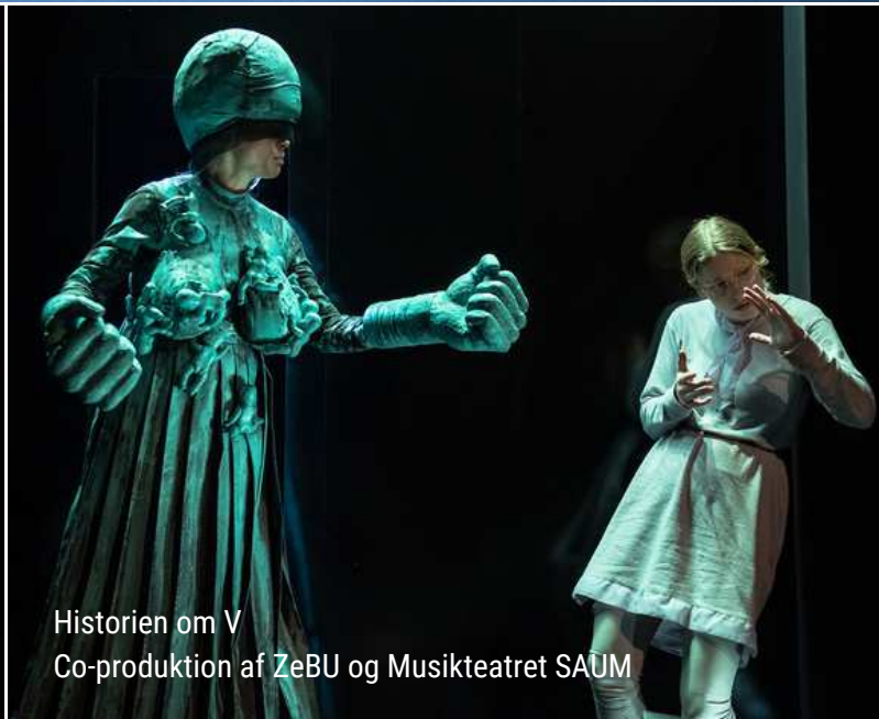
Historien om V Co-produktion af ZeBU og Musikteatret SAUM