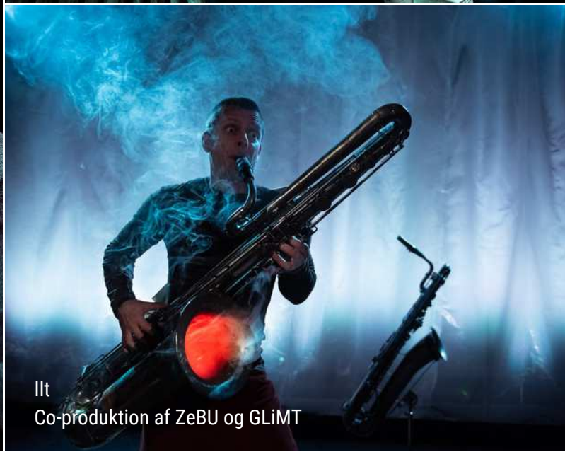
Ilt Co-produktion af ZeBU og GLiMT