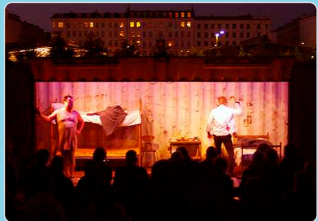
Edderkoppekvindens Kys 2 (2011) opført på Israels Plads og i Kødbyen i en 20-fods mobil container-scene.

Siden 2012 har teatret opført forestillinger på andre teatres scener i København, site-specific, på gaden eller i parker og rundt på skoler/uddannelsesinstitutioner. Samlet har vi spillet 78 forskellige steder i Storkøbenhavn, hvor størstedelen af spillestederne er folkeskoler.