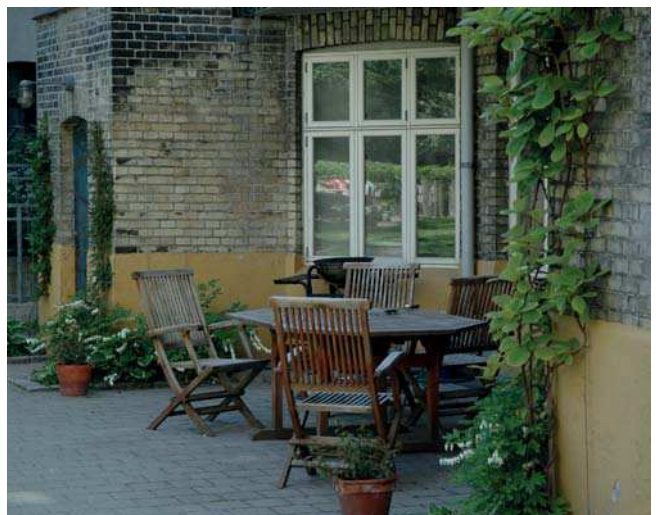
Inspiration til den fremtidige gårdhave