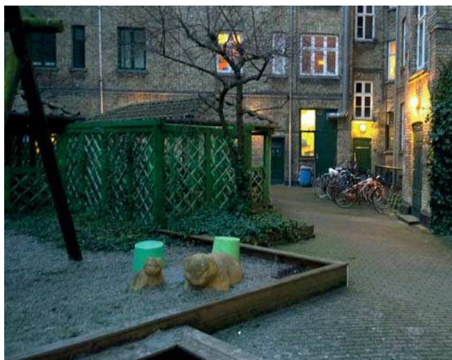
Inspiration til den fremtidige gårdhave

befæstelser. Herudover etableres plantebede med stort bladdække.