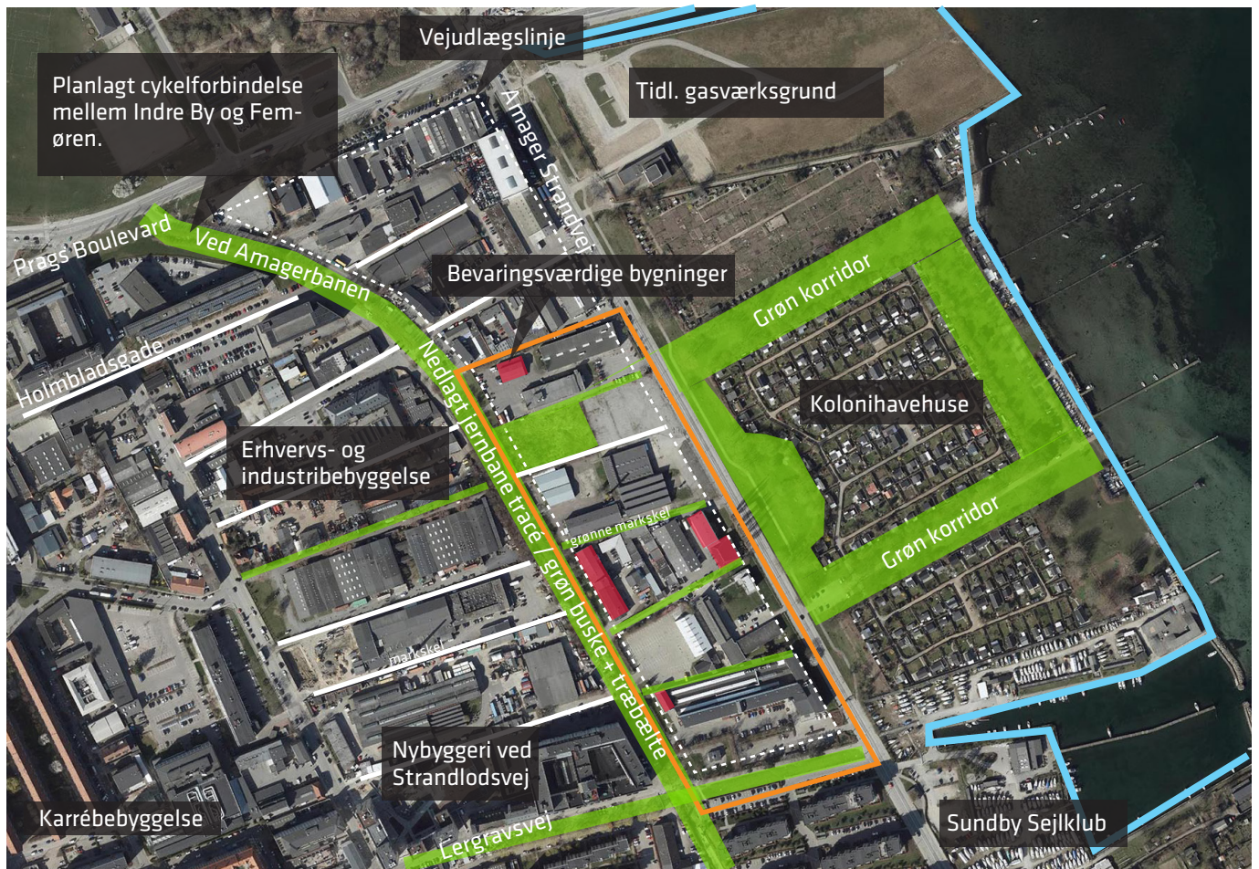
Luftfoto, der viser lokalplanområdet (med orange streg) og nabogrundenes karakteristika.

og mere åbenhed mod kolonihaverne og lystbådehavnen, samt et åbent og visuelt sammenhængende område, hvor der sikres sammenhæng med naboområderne. Endelig er de lokale borgere og aktører bekymrede for den øgede trafik på Amager Strandvej, Strandlodsvej og Lergravsvej og påpeger vigtigheden af at sikre gode forbindelser til den kollektive trafik og gode forhold for cyklister og gående.