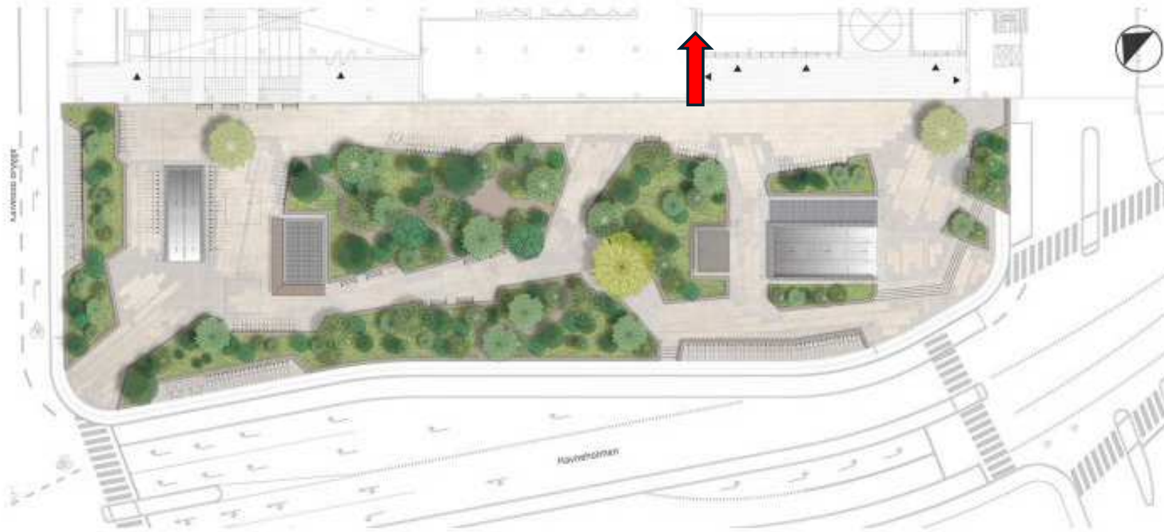
Visualisering af den kommende metroforplads. Illustration: SLA.