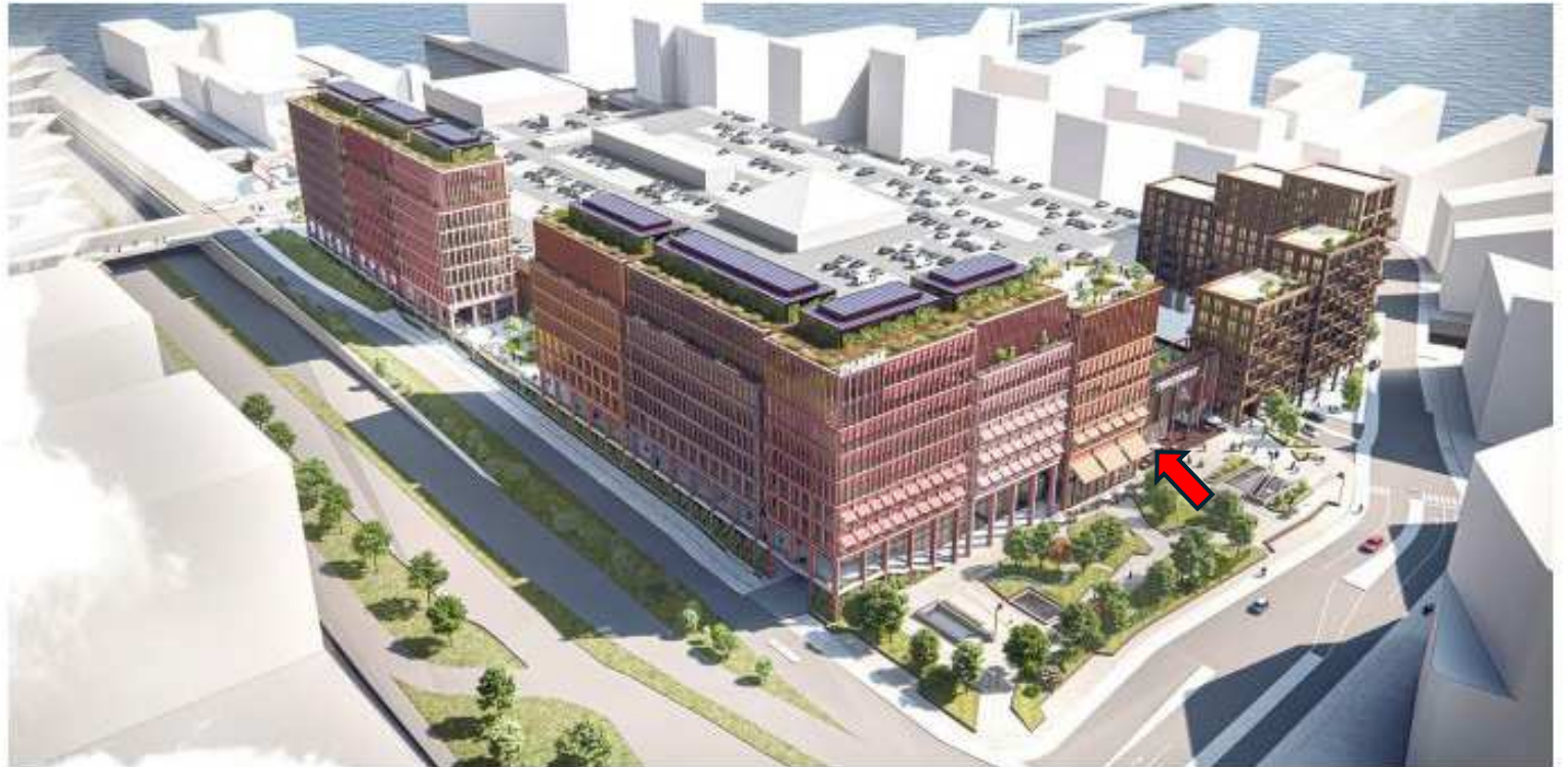
Visualisering, der viser et eksempel på et nybyggeri i overensstemmelse med lokalplanen set mod øst. Illustration: SHL