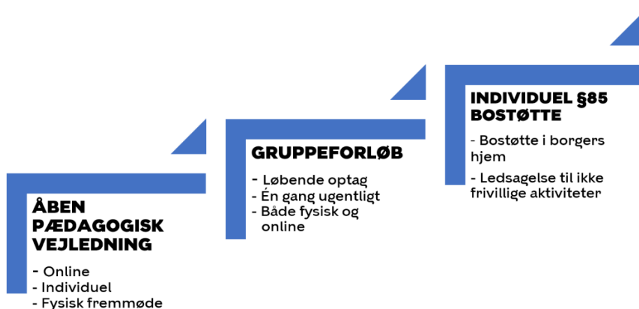
Figur 1: Spektrum af flere måder at drive bostøtte på

Nedenfor ses en illustration af spektret af forskellige måder, hvorpå Borgercenter Handicap yder socialpædagogisk støtte (§ 85):