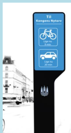
Prototype af skilt

Resultaterne af testen viste, at cyklisterne gerne vil køre en mindre omvej, hvis det betyder mindre trængsel eller en smukkere rute. Cyklisterne var generelt utilfredse med andre cyklisters opførsel og var positive overfor skiltets opdragende funktion. Det blev vurderet positivt, at cykelskiltet ville føre til en øget prioritering af information til cyklister.