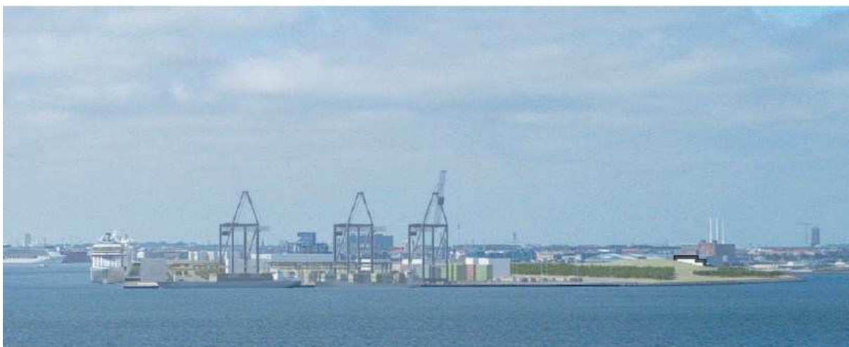
Den nye bebyggelse set fra nord. Her kan bebyggelsen ses til højre i billedet fra Øresund. By & Havn har valgt at vise fremtidige kraner i den nye containerterminal til venstre i billedet.