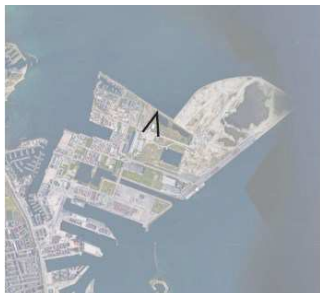
Viklen angiver hvor billedet ovenfor er set fra.