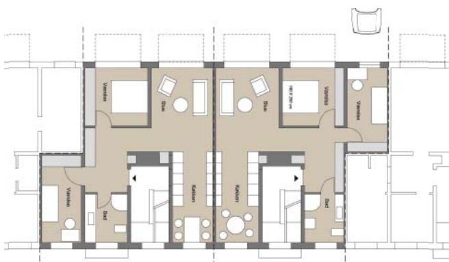
Eksempler på nye boligtyper i sammenlagte lejligheder