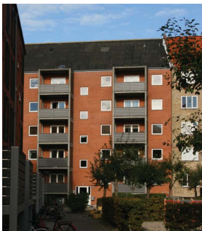
Bebyggelsen set fra gårdsiden