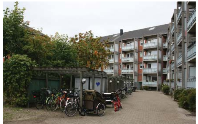
Bebyggelsens gårdrum i dag.