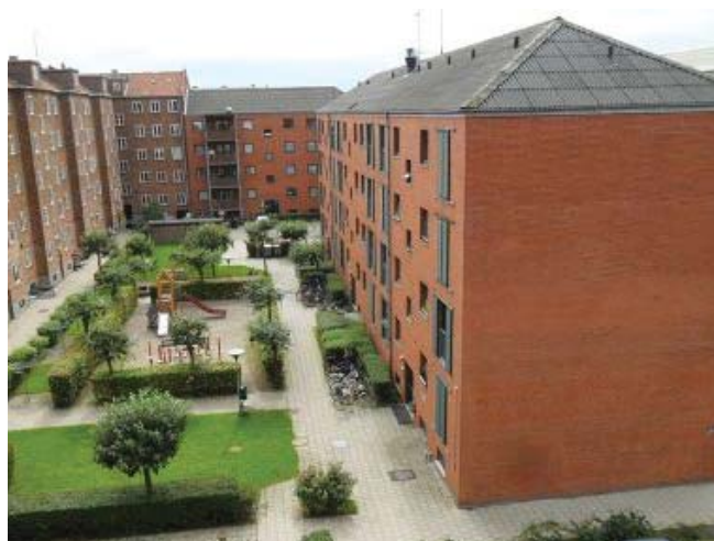
Bebyggelsen set fra gårdsiden