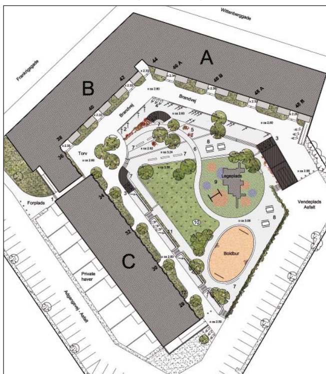
Planskitse af den nye indretning i gården.