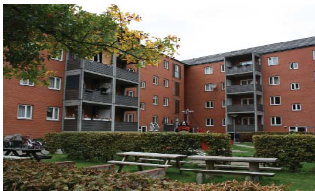
Bebyggelsen set fra gårdsiden.