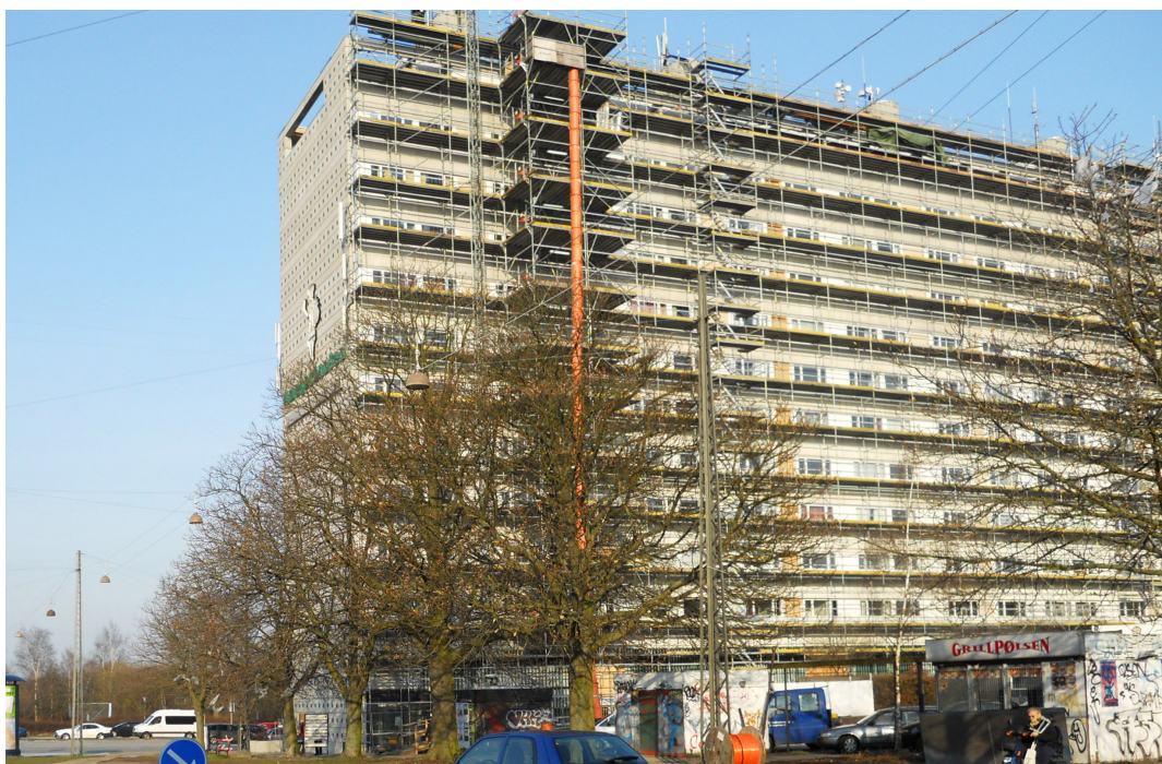
Kollektivhuset under reovering