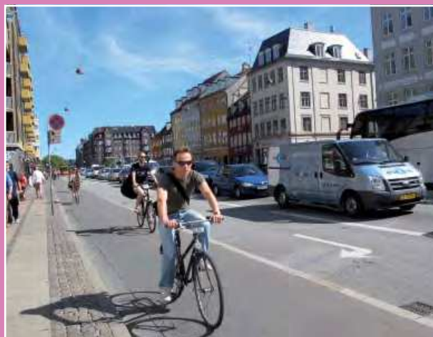
DEN GENNEMKØRENDE TRAFIK

Lokaludvalget vil arbejde på, at Inderhavnen skal være et større aktiv for borgerne end tilfældet er i dag, men også at man skal være varsom med permanente installationer i havnen. Lokaludvalgene ønsker at sikre fri adgang til kanten af havnebassinet ved at friholde bolværkerne for permanente installationer; parkeringspladser; udeserveringer mv.