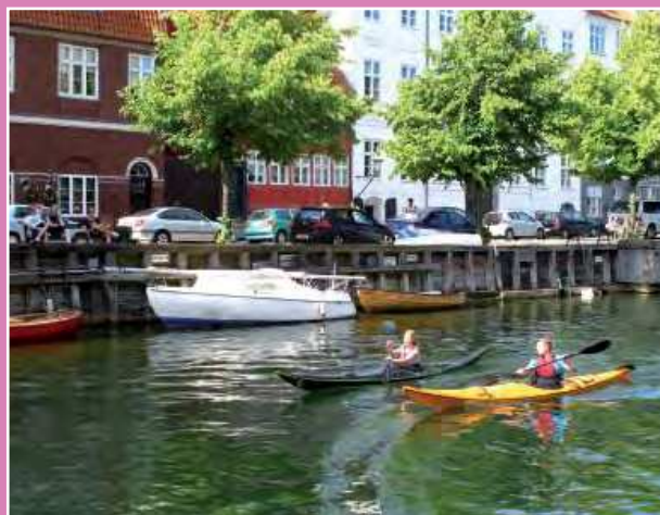
INDERHAVNEN SOM KREATIVT BYRUM