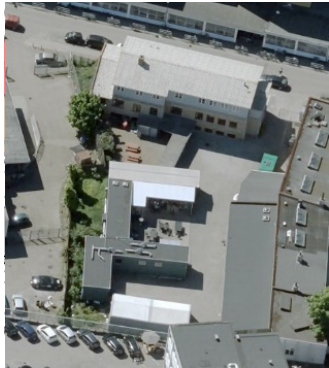
4) Gørtlervej 2-4, Lygten 29 og Rebslagervej 6