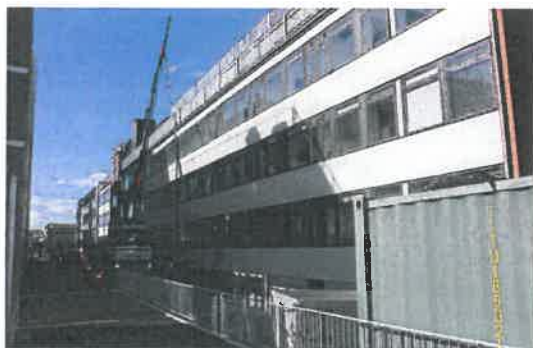
Industrihuset, Krimsvvej 29. I slutningen af 1960'erne husede bygningen Buntmagerskolen og Frisørskolen.

Københavns Museum bakker op om bevaringen af Krimsvvej 29, der i 1960 blev opført som Industrihus af arkitekt Poul Frederiksen for Gas- og Vandmester Frode Hansen. Bygningen er i 4 etager, bygget med parkeringskælder og tagterrasse, og blev lejet ud til F.A. Philips, som havde lager, serviceværksted og montage i bygningen.