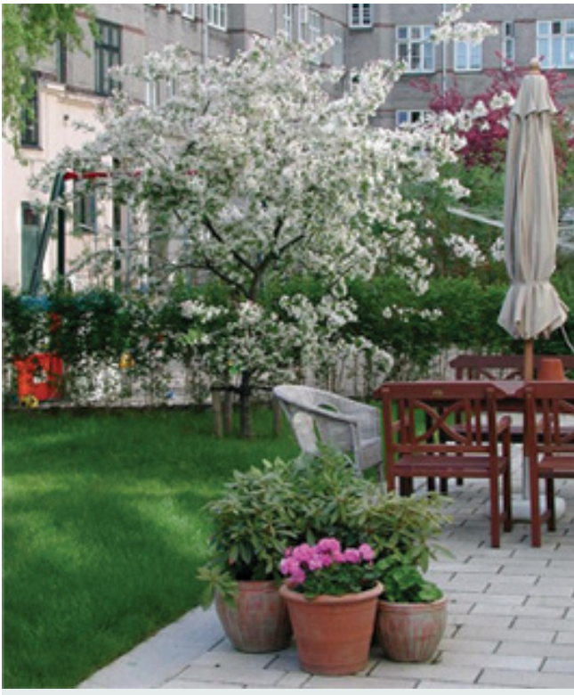
Eksempel på et mindre træ, et paradisæble

Det tilstræbes, at beplantningen skal være nem at vedligeholde. Generelt plantes hjemmehørende arter for at fremme biodiversitet og sanselige naturoplevelser i gården.