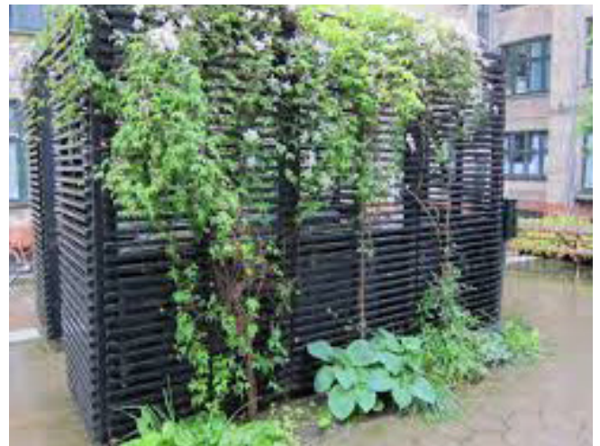
Eksempel på begrønning af et skur