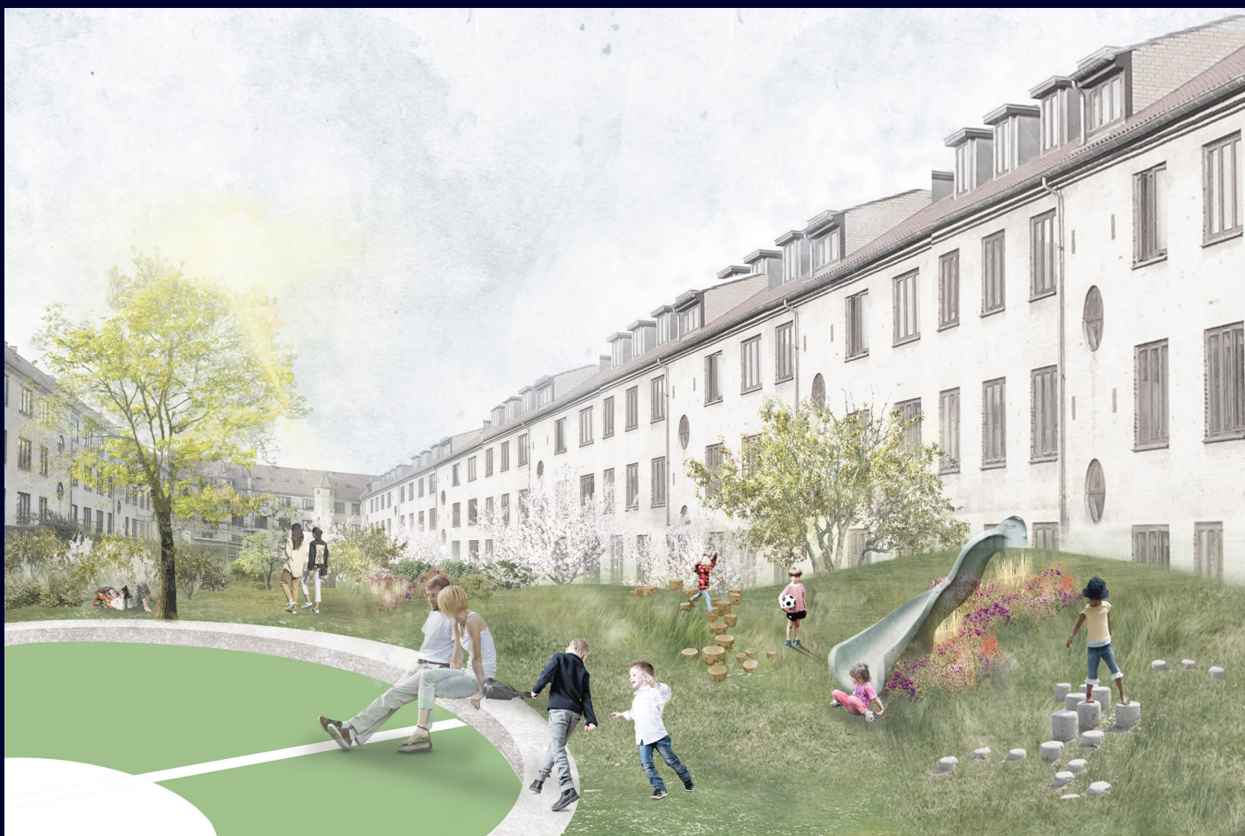
Illustration af den fremtidige gårdhave (MASU Planning)