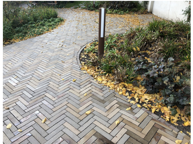
Eksempel på ny belægning.

Der etableres lav orienteringsbelysning i form af pullertbelysning i gården langs de nye gangstier, og supplerende belysning af skure i nødvendigt omfang.