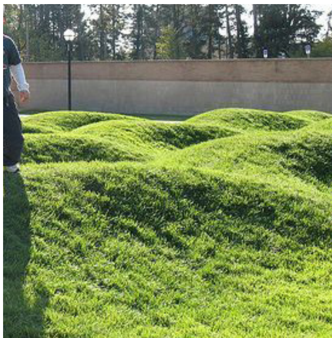
Eksempel på små bakker/terrænformer i græs

Boldbanen, som er forsænket 40 cm, anlægges med gummibelægning, og kan også fungere som festplads ved særlige lejligheder. Banen skærmes af mod beboelsesvinduer. Hvis økonomien tillader det, sættes en træbro over regnbedet.