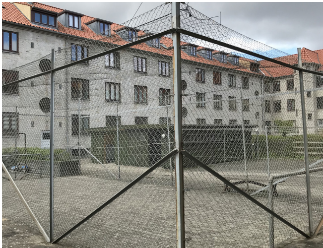
Eksisterende boldbur af trådhegn og betonbelægning

MASU Planning har udarbejdet forslag til ny fælles gårdhave for Kalvebodhus. Skitseforslaget er udviklet i tæt samarbejde med Københavns Gårdhaver og beboerne på en række beboermøder og en inspirationstur. Mødedeltagerne har aktivt påvirket og fået afgørende indflydelse på udformningen af det foreliggende forslag til gårdhavens indretning.