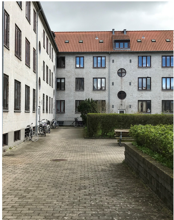
Kig ned langs facade med meget belægning

Gården fremstår nedslidt uden særlig meget beplantning. Der er forholdsvis meget belægning i gården, som består af ældre beton fliser.