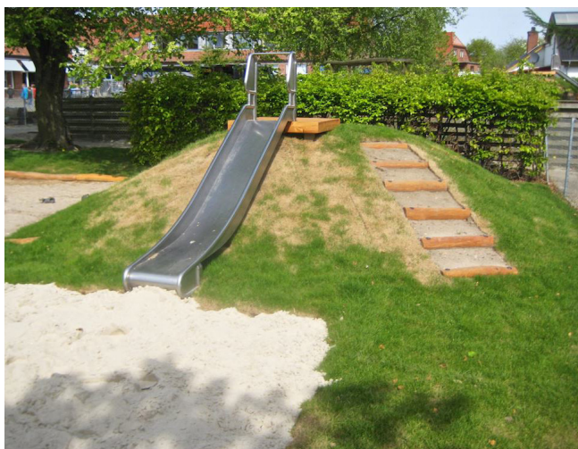
Eksempel på rutsjebane på en græsbakke