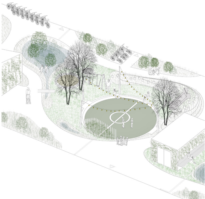
Digitalt billede af nedsænket boldbane/festplads (MASU Planning)

Der er mulighed for uformel ophold på græsplæner og bakker, og der kan desuden sættes bord/bænkesæt på den nye belægning - så vil der være plads til både fælles og privat ophold.