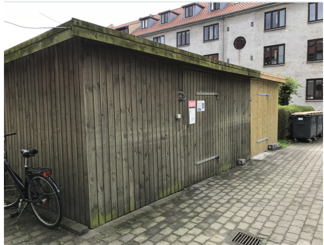
Skurenes bevares og forskønnes

Beethovensvej-karréen er en klassisk, lukket karré fra 1930'erne med to porte og fokus på det funktionelle. Den er anlagt som en "spejlægsgård", med belægning langs facaderne og to firkantede områder med græs i hver ende til ophold.