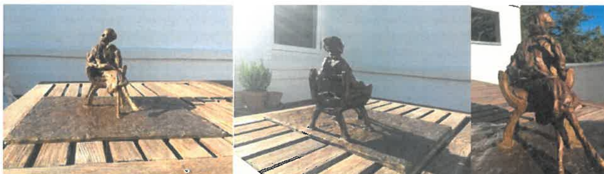
Støbt i bronze forlægget til fuldfigursportræt i model størrelse af Karen Blixen, udført af billedhugger Rikke Raben færdiggjort i juni 2018.

Med udgangspunkt i vores hovedstad og traditionen med at opstille portrætter af markante danskere i det offentlige rum, vil det være naturligt at en af vores mest berømmede forfattere Karen Blixen, får en statue i København, så også hun kan symbolisere vores kunnen og vores værdier.