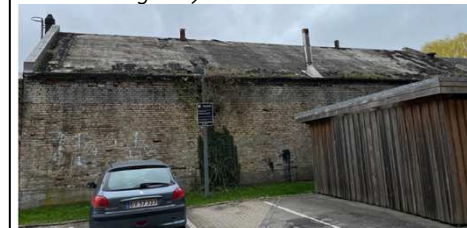
(fra ansøgningsmaterialet - set fra Fogedgade)