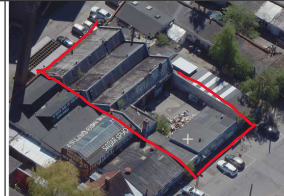
(KK Kort 2023)