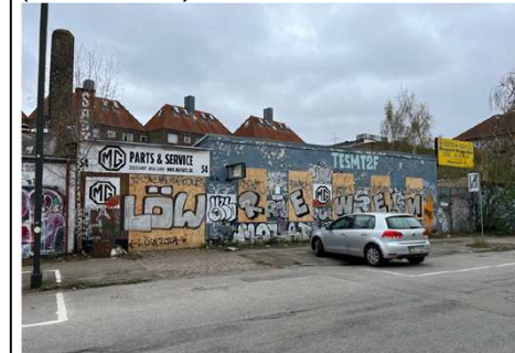
(fra ansøgningsmaterialet - bygning set fra Rådmandsgade)