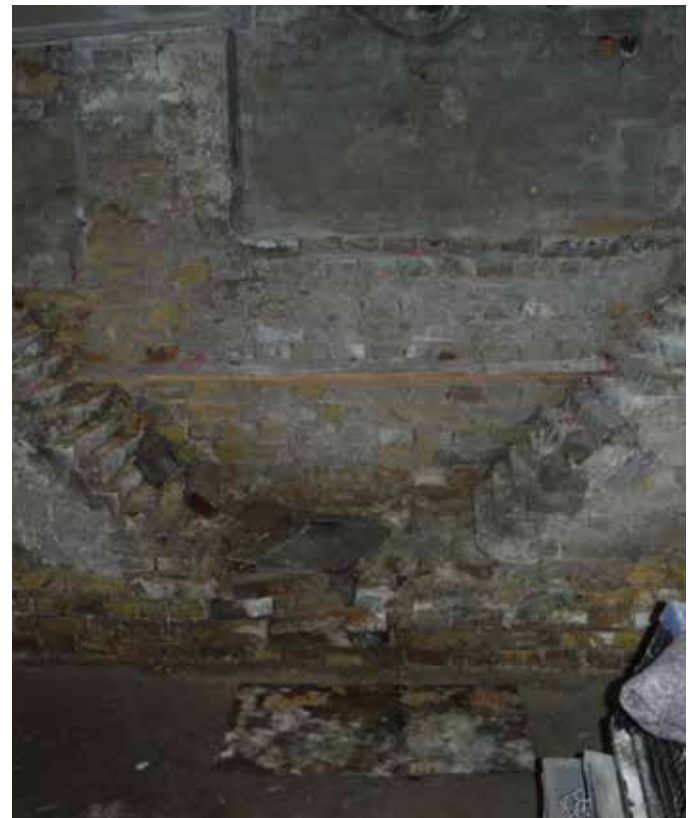
Der fugt- og klimasikres og isoleres