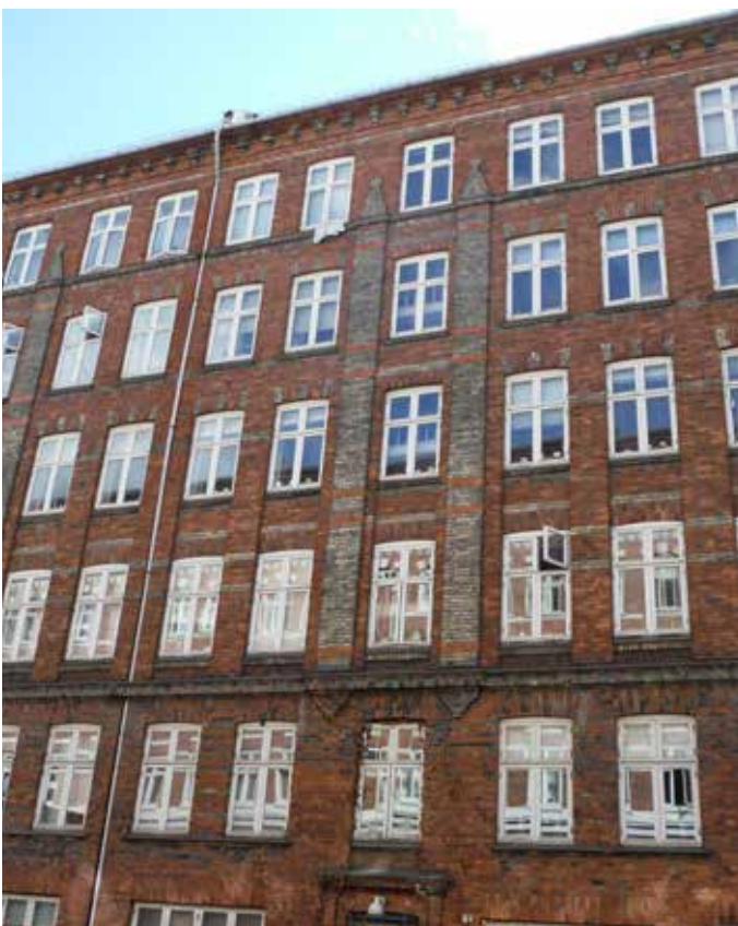
Facader mod gade