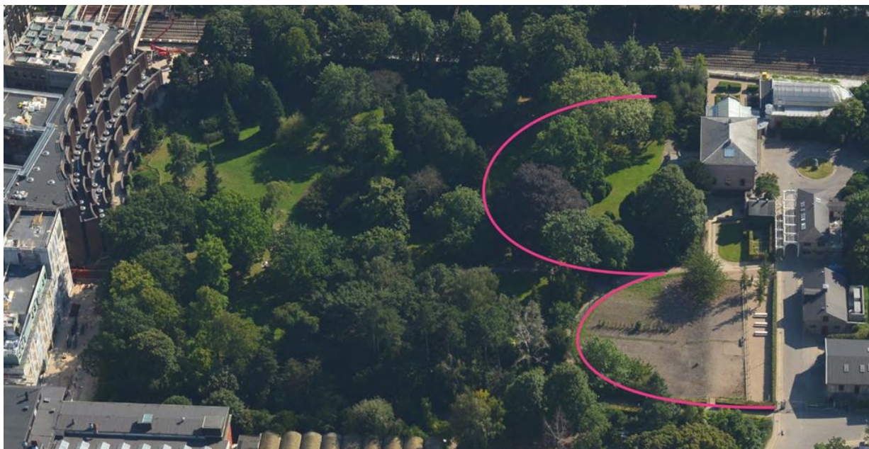
Luftfoto med den nuværende hegning af Æresboligen og hestefolden i J. C. Jacobsens Have

Der er tale om lovlige, eksisterende forhold. Det foreslås at tilføje en bestemmelse i tillæg 6 om, at toldområdet må heges. Toldområdet vil dog ikke kunne tælle med i det fælles friareal.