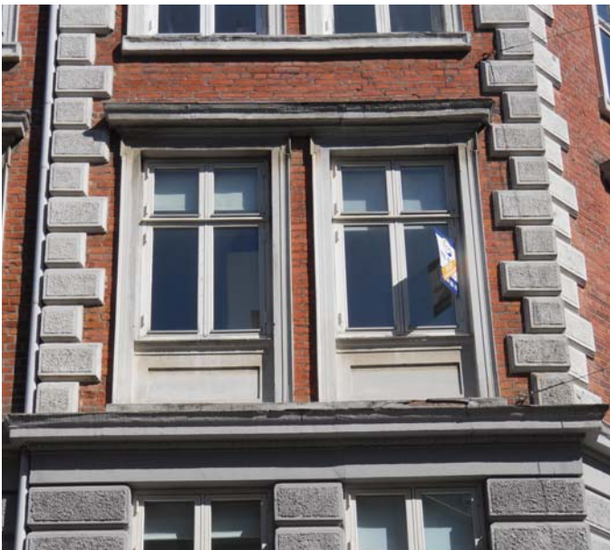
Vinduer udskiftes på gård- og gadeside