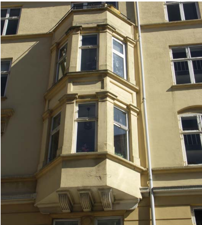
Facade istandsættes og vinduer udskiftes