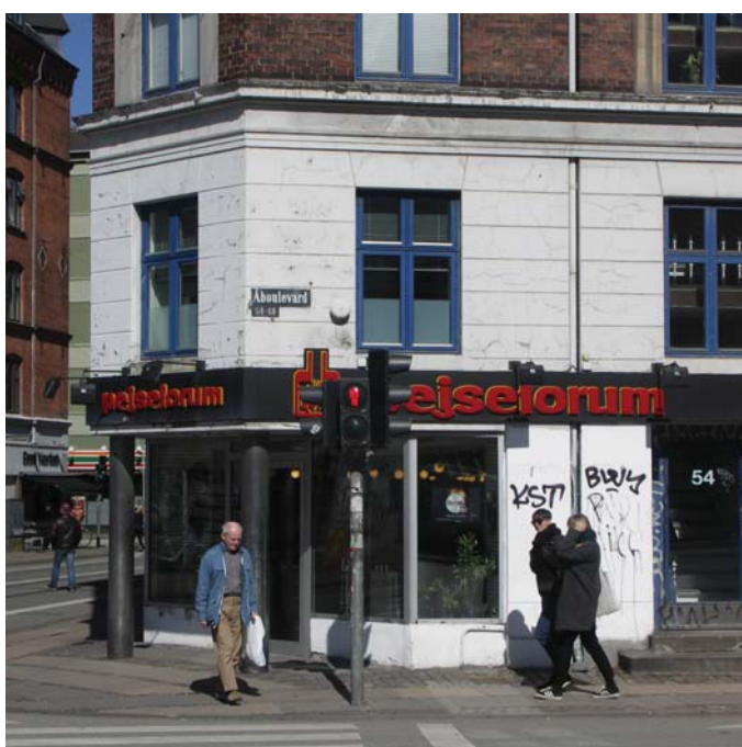
Vinduer udskiftes og underfacade renoveres