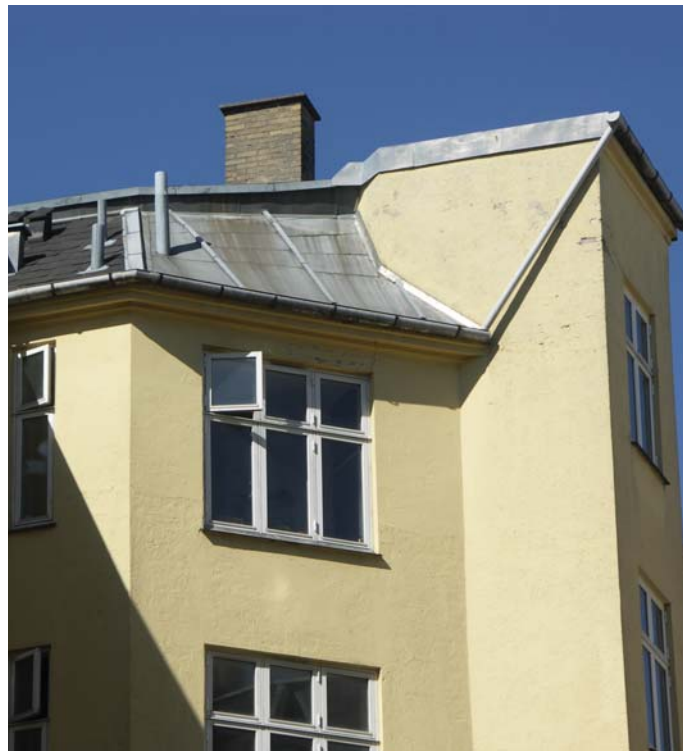
Tag udskiftes og isoleres