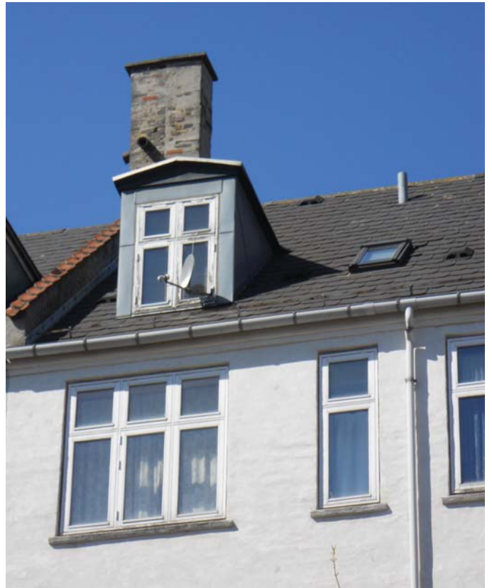
Tag og skorstene eftergås