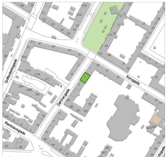
BYENS FYSIK, OMRÅDE- OG BYFORNYELSE 15