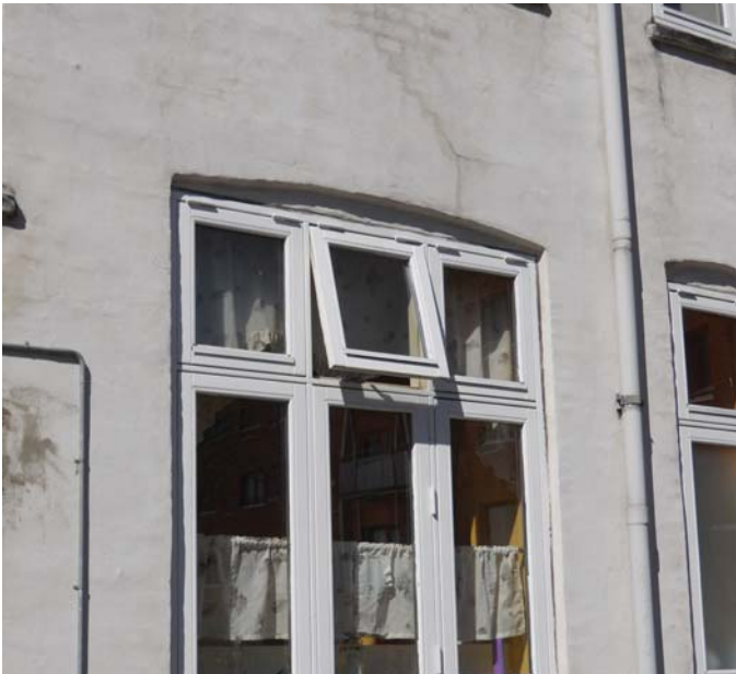
Vinduer udskiftes på gård og gadeside