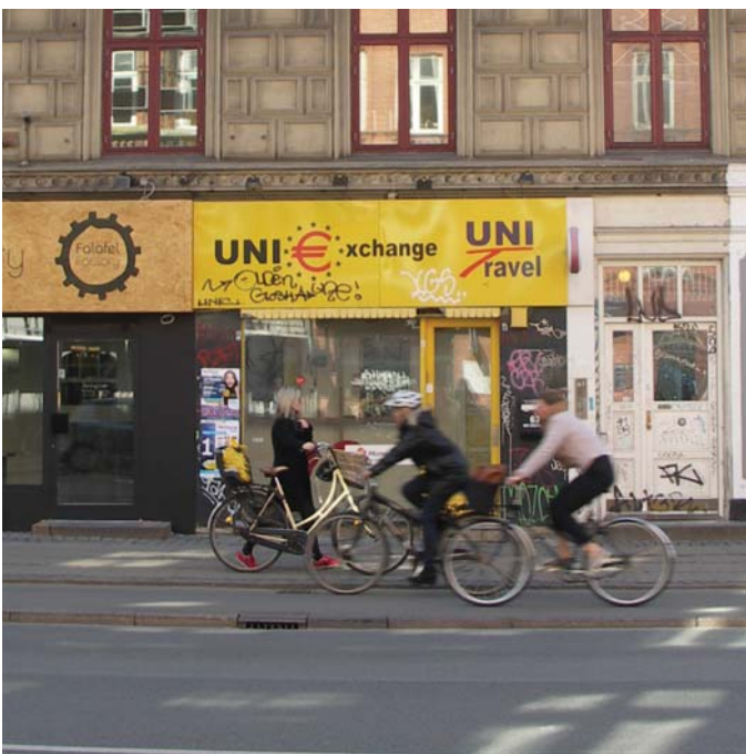
Facade istansættes og der laves ny skiltning