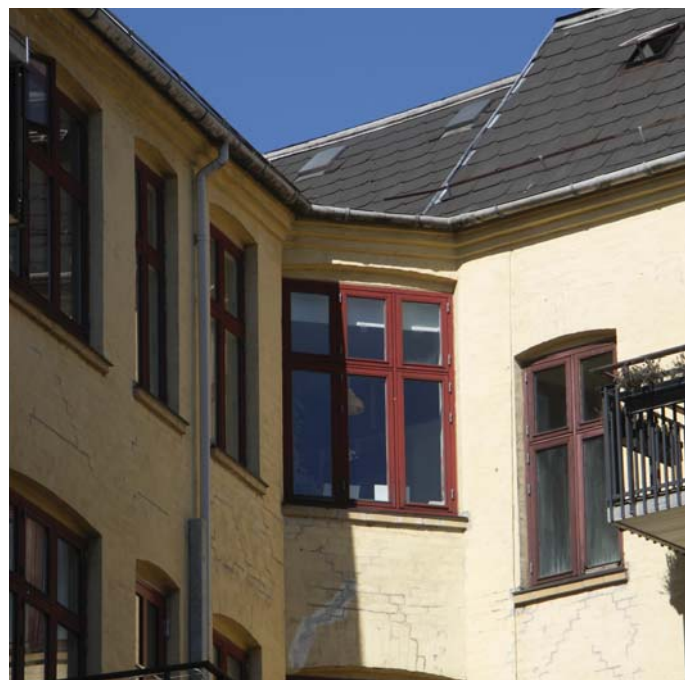
Nyt tag, tagrender og efterisolering