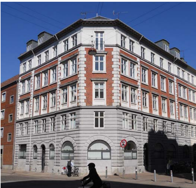
Ejendommen set fra gadesiden