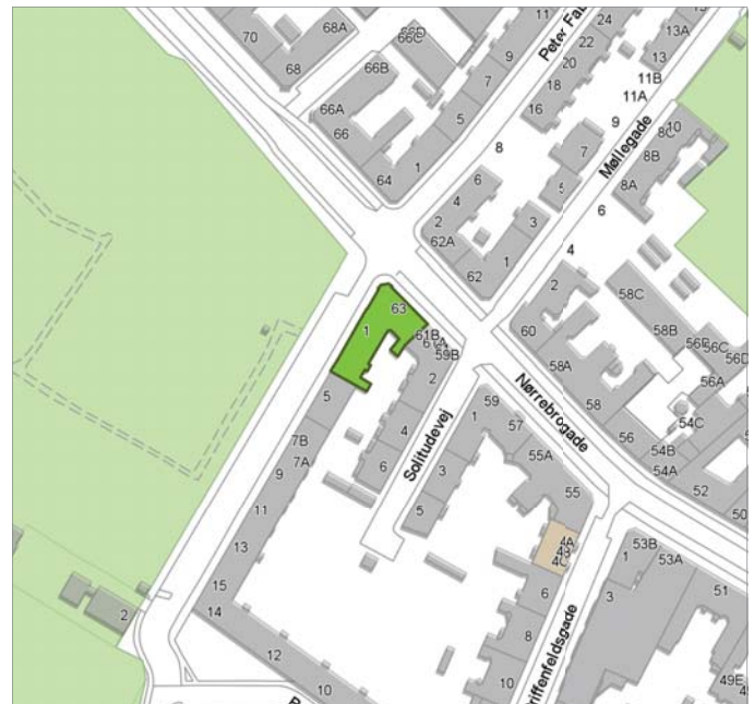
BYENS FYSIK, OMRÅDE- OG BYFORNYELSE 7