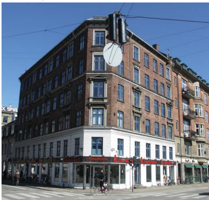
Facade mod gadeside