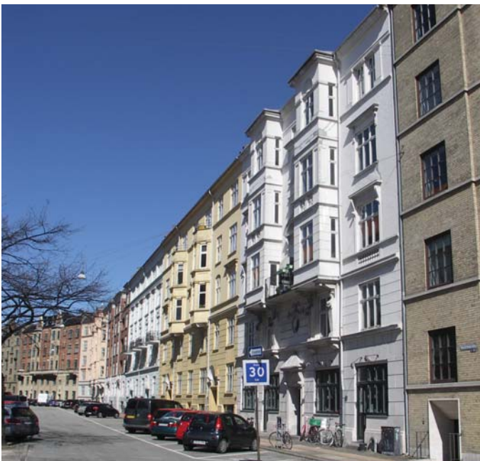
Facade mod gadeside