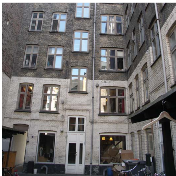
Gårdfacade renses og omfuges