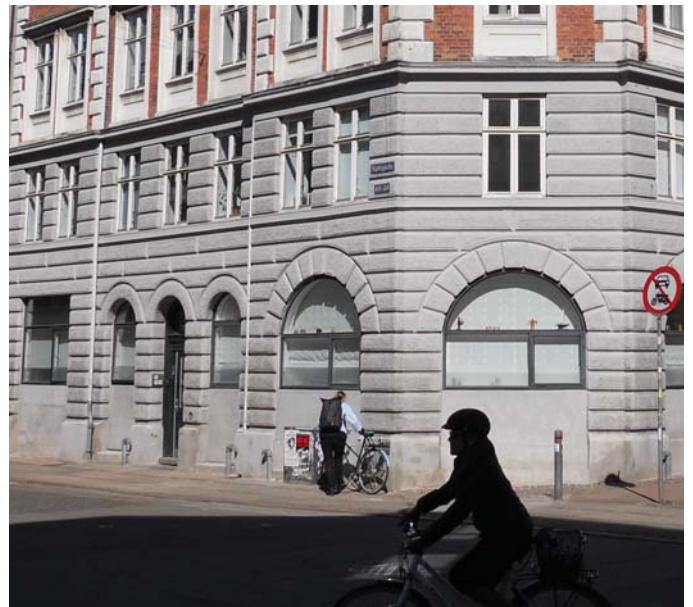
Døre istandsættes og males