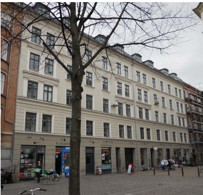
Facade mod gadeside