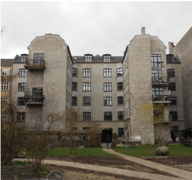
Facader mod gård og gade istandsættes