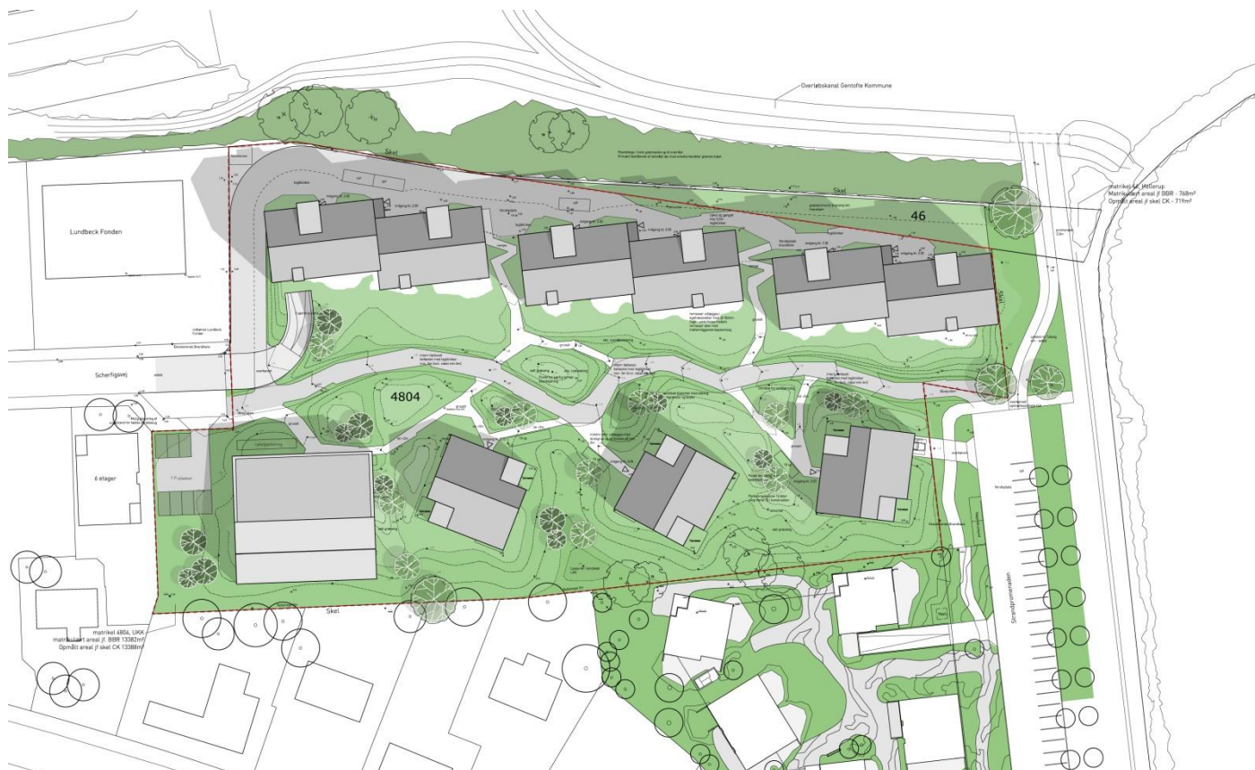
Illustration der udskiftes i lokalplanforslagets redegørelsesdel (side 8)

(Undertekst) Situationsplanen viser bebyggelsens placering og det planlagte stisystem. Til højre i billedet vises afslutningen af Strandpromenaden, hvor en udbygningsaftale sikrer en integreret afslutning af Strandpromenaden.