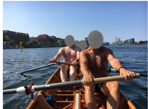
Midt i åretaget, hvor båden opnår en hastighed på 8-10 km/t