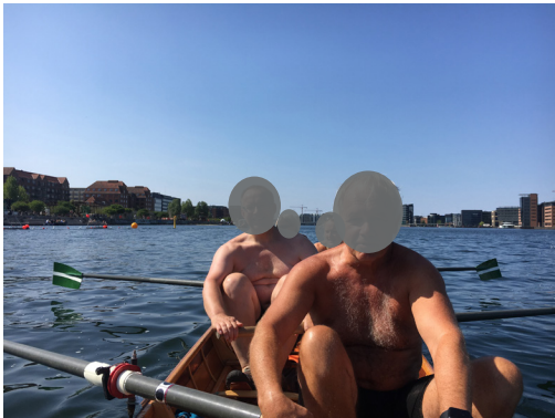
Starten af åretaget, hvor åren går i vandet