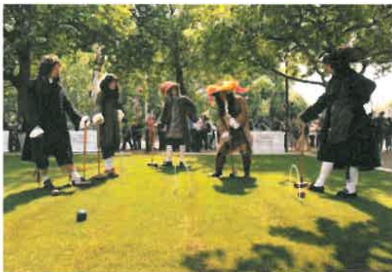
Pall Mall spilles i en krocket- lignende udgave i Londons byrum, 2009.

I Kongens Have kan man deltage i spillet Pall-Mall, der var populært ved flere europæiske hoffer i 1600-tallet. Spillet er en mellemting mellem krocket og golf. Der vil både blive etableret en børnebane og en 300 meter lang bane for voksne i én af havens alléer.