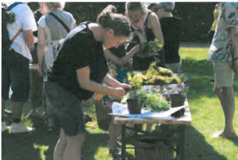
Park Life 2013, Kongens Have

Se vedhæftede program fra Park Life 2013.