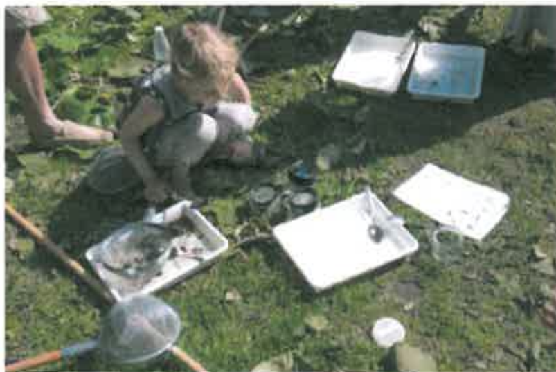
Park Life 2013, Østre Anlæg

Et omfattende program af aktiviteter ude og inde åbnede en ny tilgang til kvarterets særlige kombination af parker og museer og gav oplevelsen af et stort frirum med det bedste fra kunsten og naturens verden.