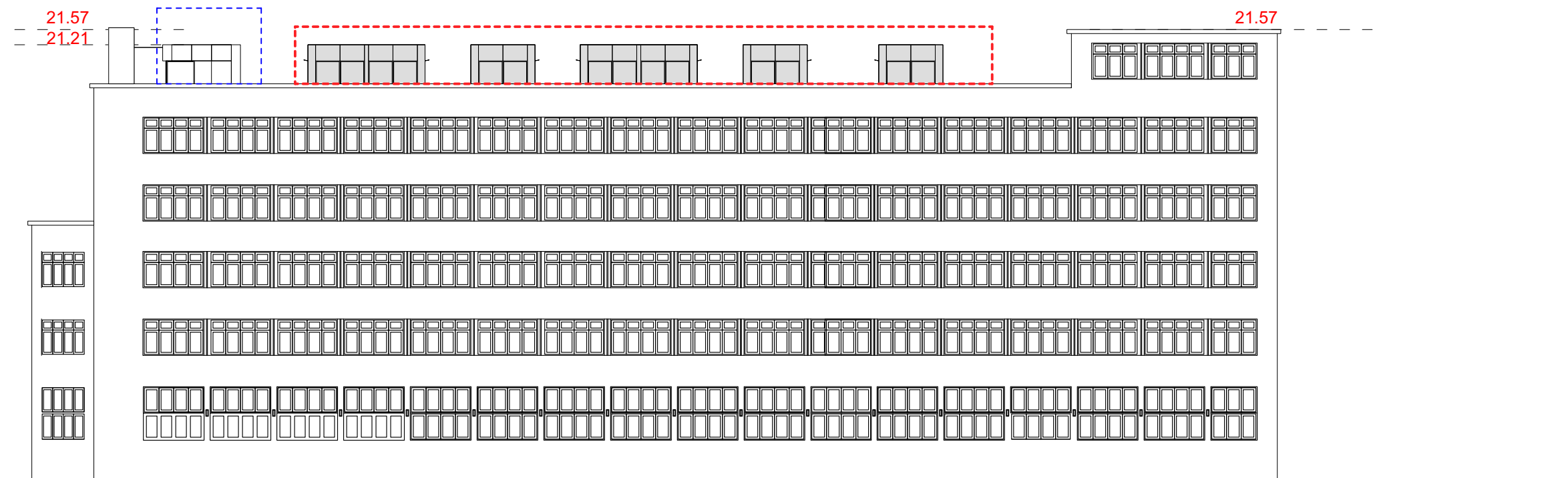
Facade mod øst