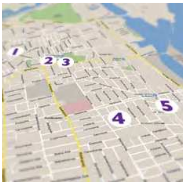
Amager Øst Lokaludvalg

I Budget 2013 er der afsat 266.000.000 kr. til genopretning af den eksisterende gadebelysning i Københavns Kommune.