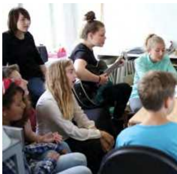
Amager Vest Lokaludvalg