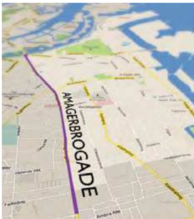
Amager Øst Lokaludvalg

Det er oplagt, at gruppen indgår i det videre arbejde.