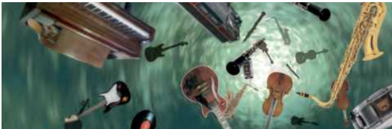
Amager Øst Lokaludvalg