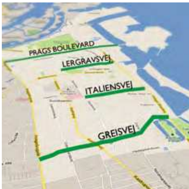
Amager Øst Lokaludvalg

Amager Vest Lokaludvalgs bydelsplanlægning omfatter bl.a. grønne tværgående cykel- og gangstier i Amager Vest. Amager