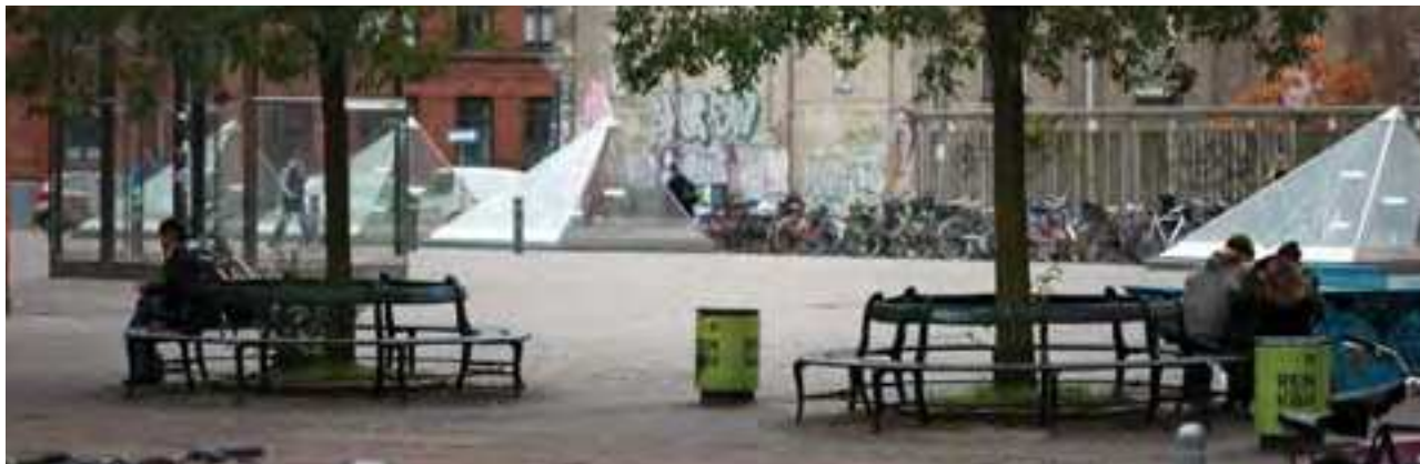
Amager Øst Lokaludvalg