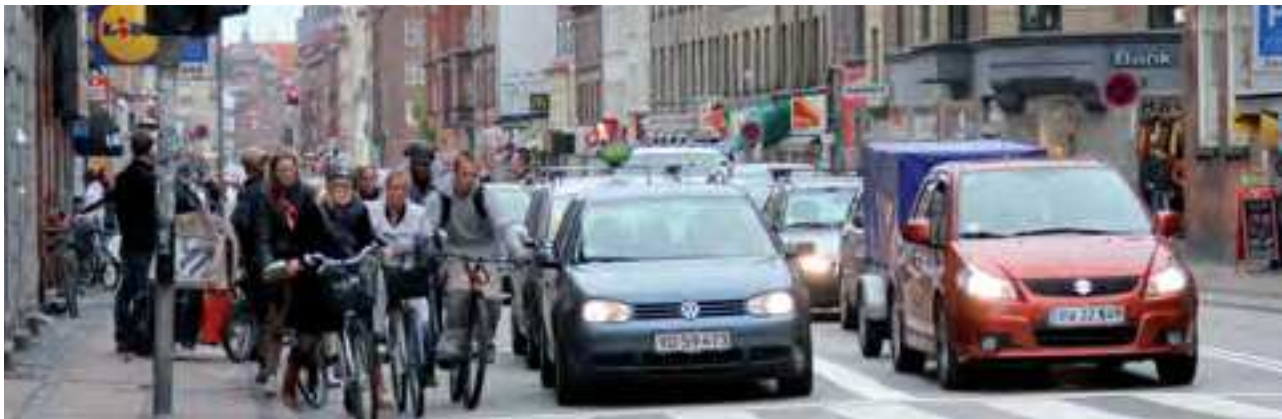
Amager Øst Lokaludvalg