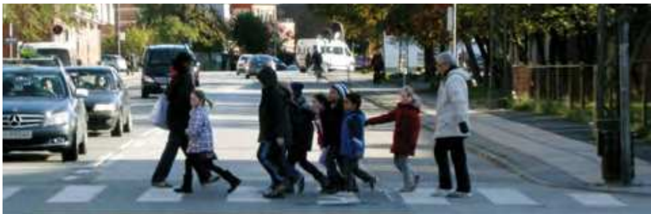
Amager Ø st Lokaludvalg