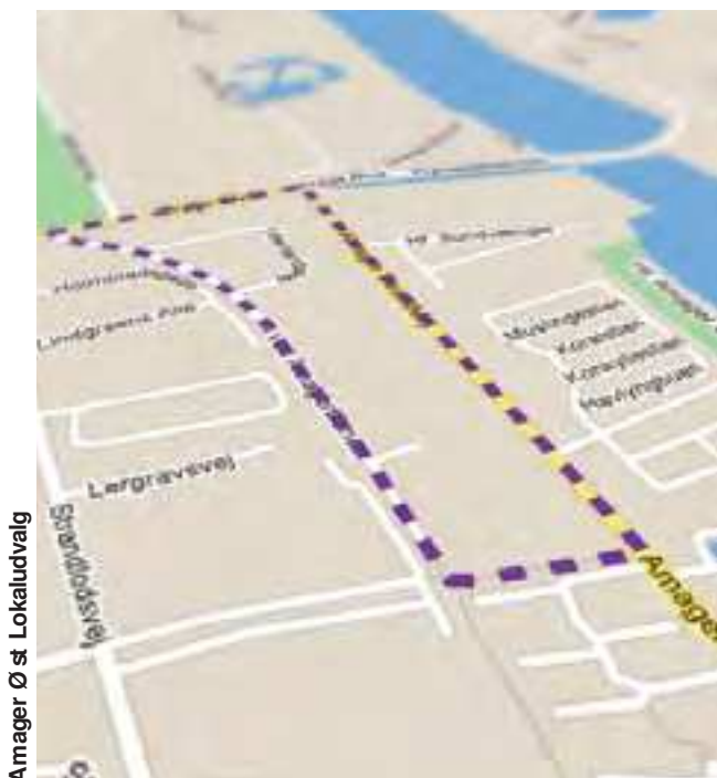
Amager Øst Lokaludvalg

Langsigtet vil en traditionel finansieringsmodel evt. kunne suppleres med tilskud fra grønne fonde.