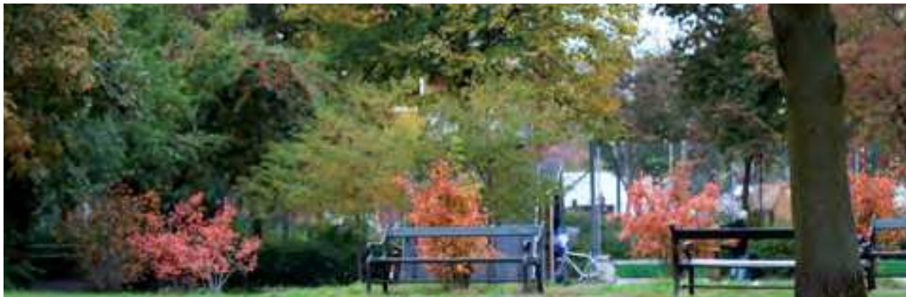
Amager Øst Lokaludvalg