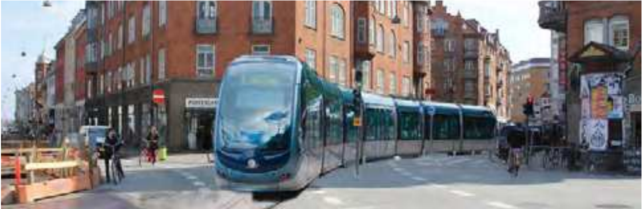
Indre By Lokaludvalg