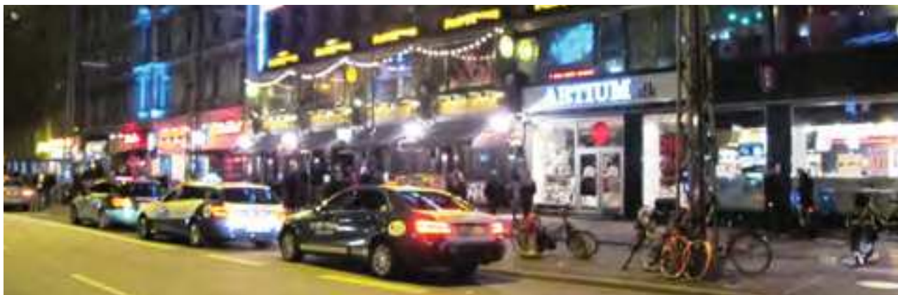
Indre By Lokaludvalg