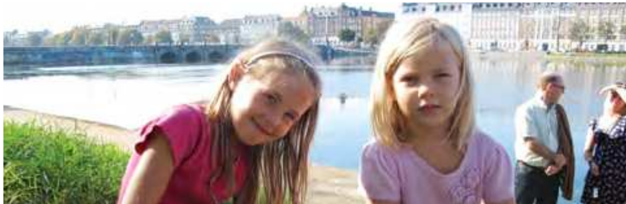
Indre By Lokaludvalg