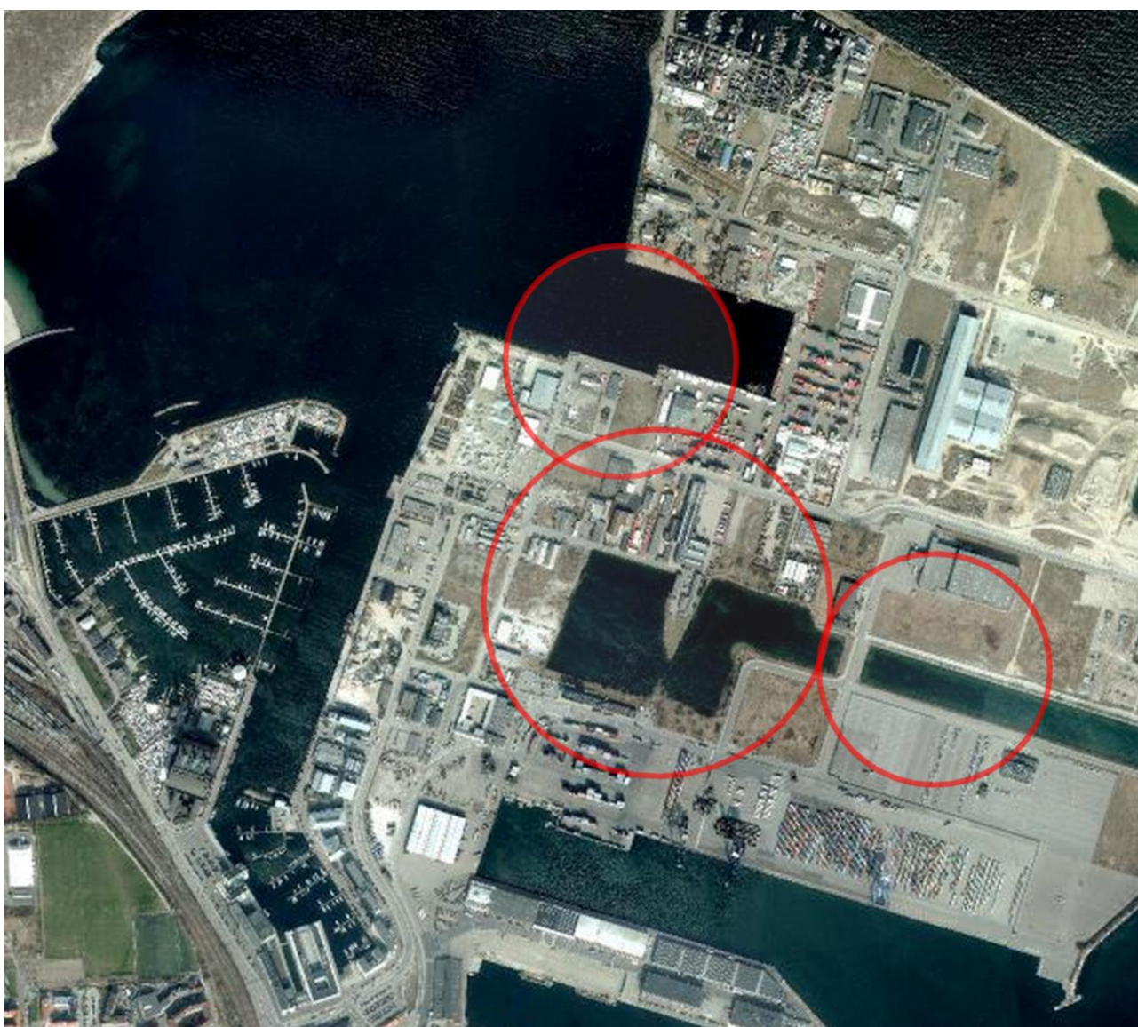
Kort over Nordhavnen og potentielle placeringer af CWWP

Indtil videre er arkitekternes bud, at det er oplagt at ligge CWWP i den gamle skudehavn. Her kunne man lave et midlertidigt frilufts- og oplevelsesmekka. Enten i inderhavnen eller i strækningen før selve den gamle skudehavn (se billede). En alternativ placering kunne være på nordsiden af Kalkbrænderihavnsløbet i forlængelse af Østerbro Lokaludvalgs Visionsoplæg om etableringen af et nyt havnebad.