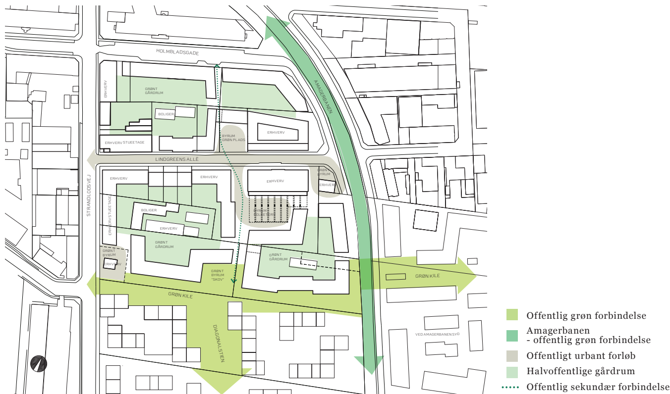
Illustration af hovedgrebet, som er en brudt karré, der trækker sig tilbage omkring de bevaringsværdige bygninger og på udvalgte steder skaber pladser. Gårdrummene indrettes med små bygninger til bl.a. småerhverv. Den grønne kile på tværs skaber forbindelse til den 'Grønne cykelroute' og 'Ved Amagerbanen Syd' og derfra videre til Amager Strandvej og Strandparken (Ill. HNAP/PLH/SLA).