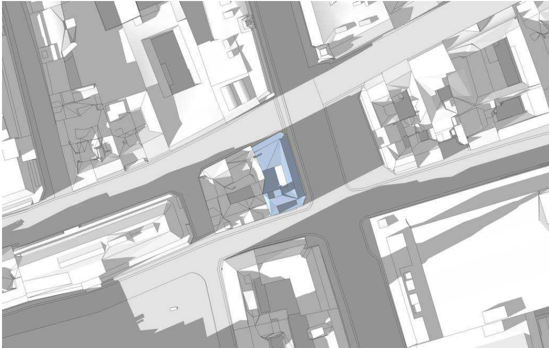
21. marts kl. 16.00. Eksisterende forhold