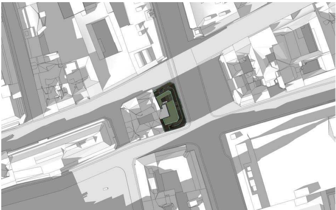
21. marts kl. 16.00. Fremtidige forhold