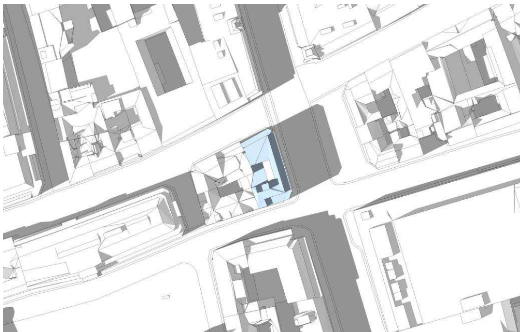
21. juni kl. 16.00. Eksisterende forhold