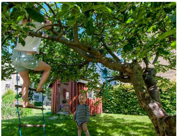
Inspiration til den fremtidige gårdhave