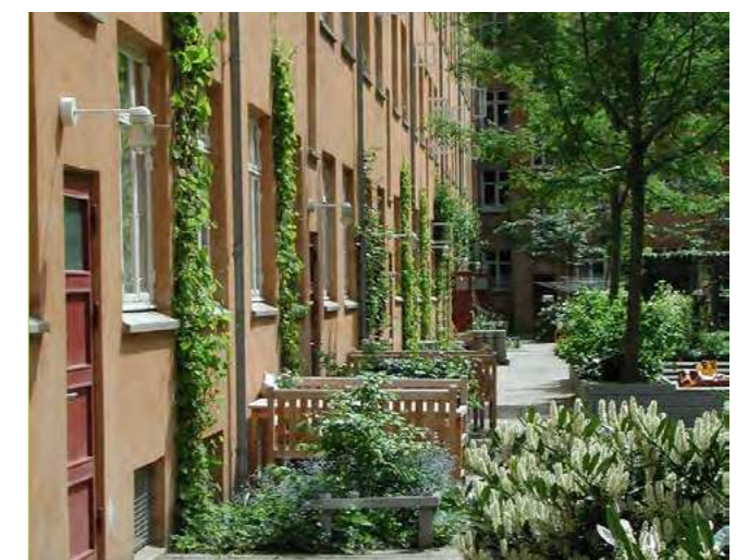
Inspiration til den fremtidige gårdhave