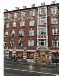
Valby Langgade 49/ Toftegårds Allé 2 SAVE 3