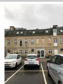
Mølle Allé 30 SAVE 4

Mølle Allé 30 Bygningen er udpeget som bevaringsværdig, fordi den fortæller om udviklingen af landsbyen, som udover også rummer værksteder og småindustri, og det fortæller om det tidligere baggårdsmiljø.