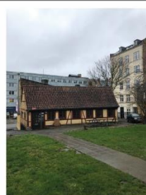
Valby Langgade 55 SAVE 6

Valby Langgade 55 Bygningen er ikke udpeget som bevaringsværdig, fordi den er brændt i 1987, og det alene den vestlige gavl, der står som oprindeligt. Den resterende del af bygningen er ikke opført som oprindeligt.