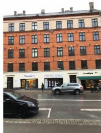
Toftegårds Allé 8-10 SAVE 4