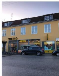
Valby Langgade 57-59 SAVE 4

Valby Langgade 51, 53 og 57-59 Bygningerne er udpegede som bevaringsværdige, fordi bygningerne i størrelse, materialer og farver udgør et særligt sammenhængende bymiljø omkring den gamle landsby ved Valby Langgade.