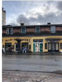
Valby Langgade 53 SAVE 4