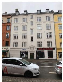
Toftegårds Allé 6 SAVE 4

Bygningerne er udpegede som bevaringsværdige, fordi de udtrykker en periodetypisk simpel arkitektur, dog med en højere grad af detaljering på hjørnehusene på henholdsvis Valby Langgade/Toftegårds Allé og Toftegårds Allé/Mølle Allé. Bygningerne danner tilsammen en harmonisk karrébebyggelse langs Toftegårds Allé og dele af Valby Langgade og Mølle Allé.