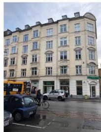
Valby Langgade 49 A-B SAVE 4