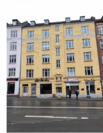
Toftegårds Allé 4 SAVE 4