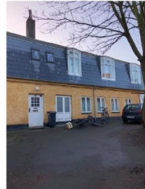
Valby Langgade 51 SAVE 4