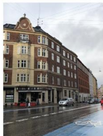
Toftegårds Allé 12-14/ Mølle Allé 18 SAVE 3