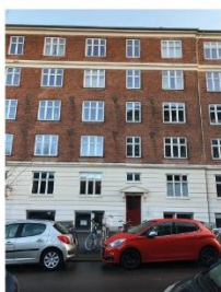
Mølle Allé 20-24 SAVE 4