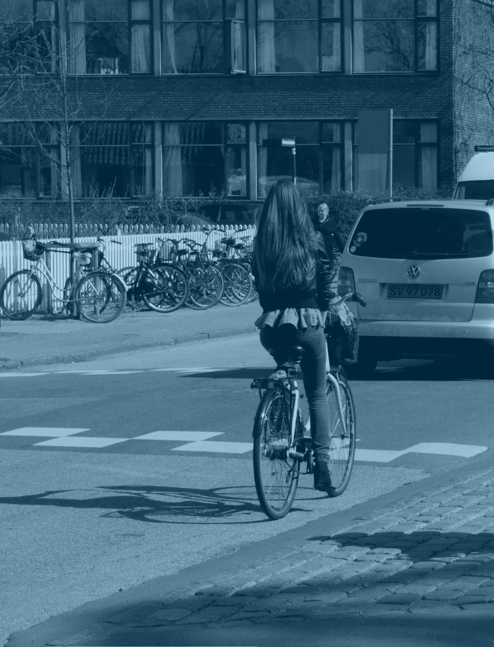
Nul-visionen har fokus på, at halvdelen af dem, der kommer alvorligt til skade eller dør i trafikken i København, er cyklister.