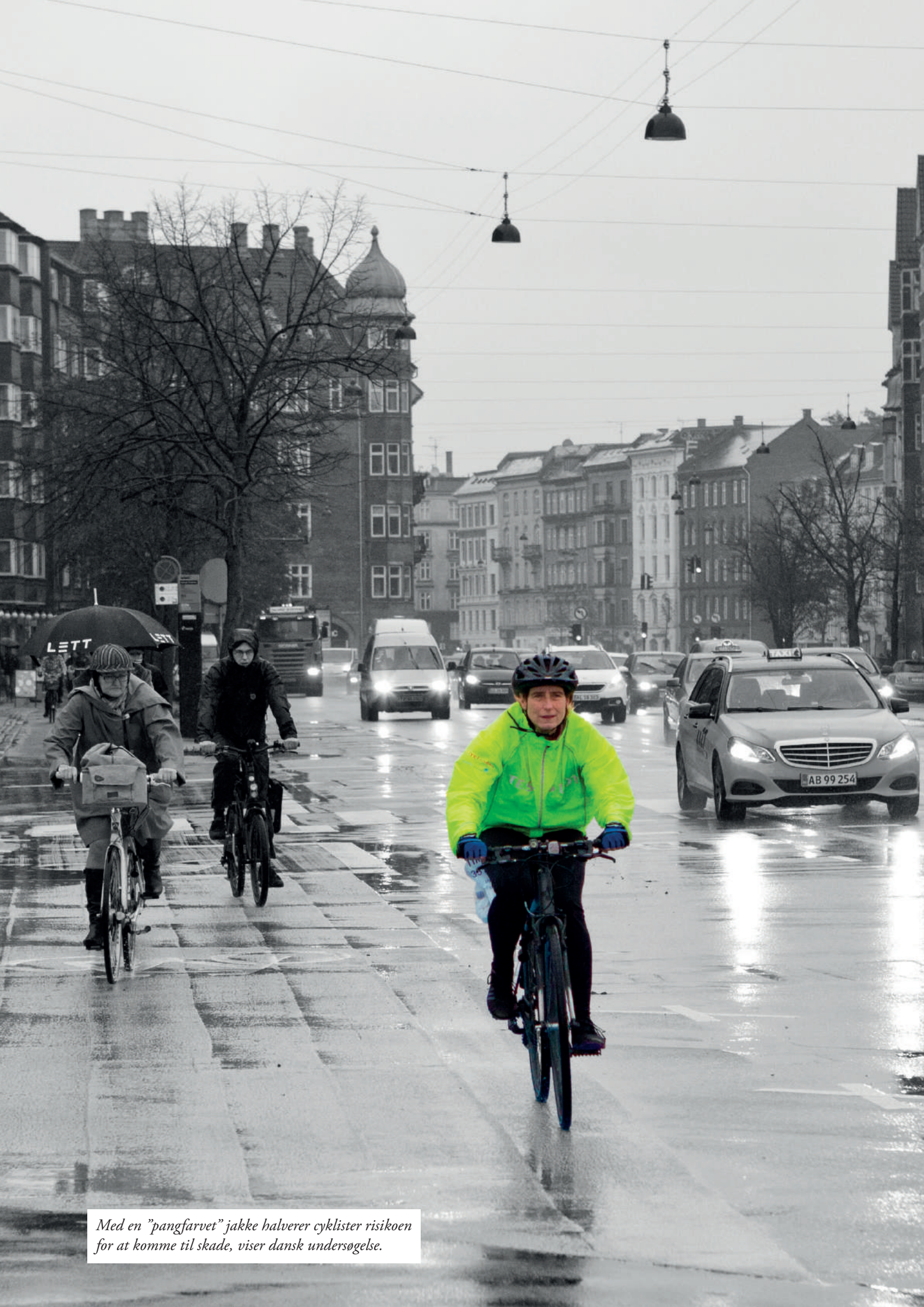
Med en "pangfarvet" jakke halverer cyklister risikoen for at komme til skade, viser dansk undersøgelse.