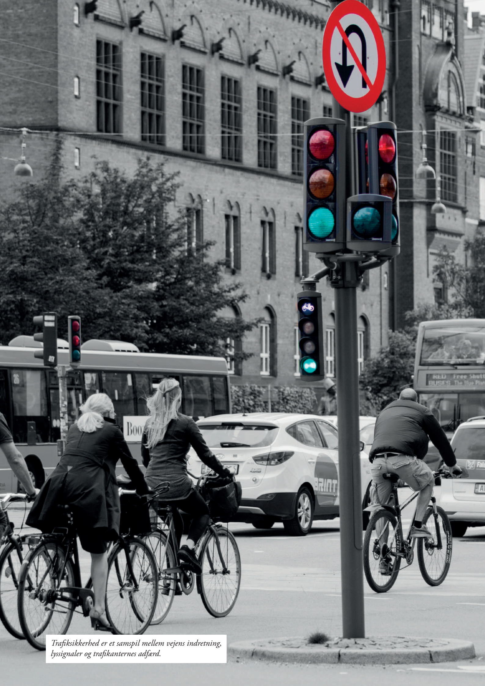
Trafiksikkerhed er et samspil mellem vejens indretning, lyssignaler og trafikanternes adfærd.