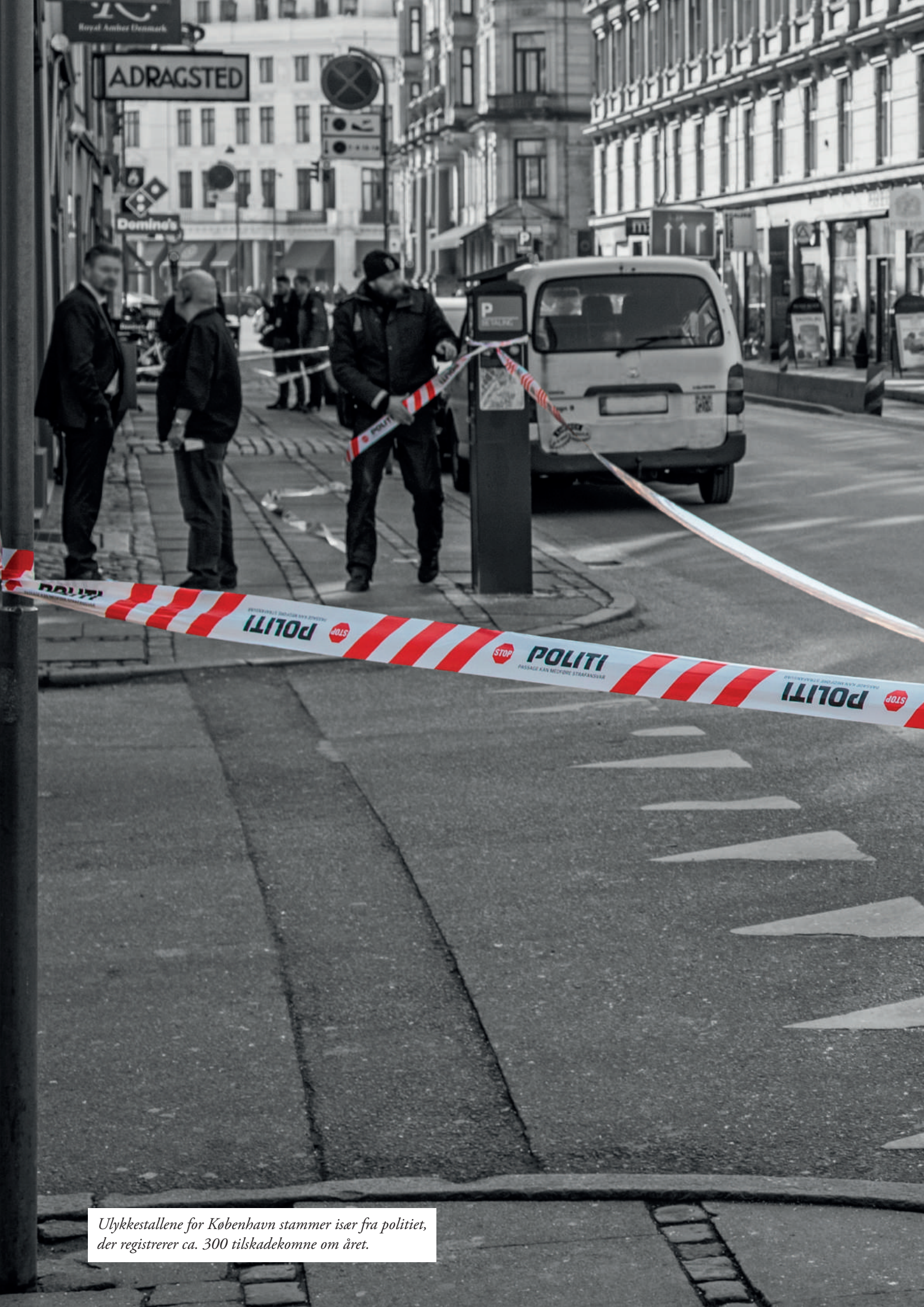
Ulykkestallene for København stammer især fra politiet, der registrerer ca. 300 tilskadekomne om året.