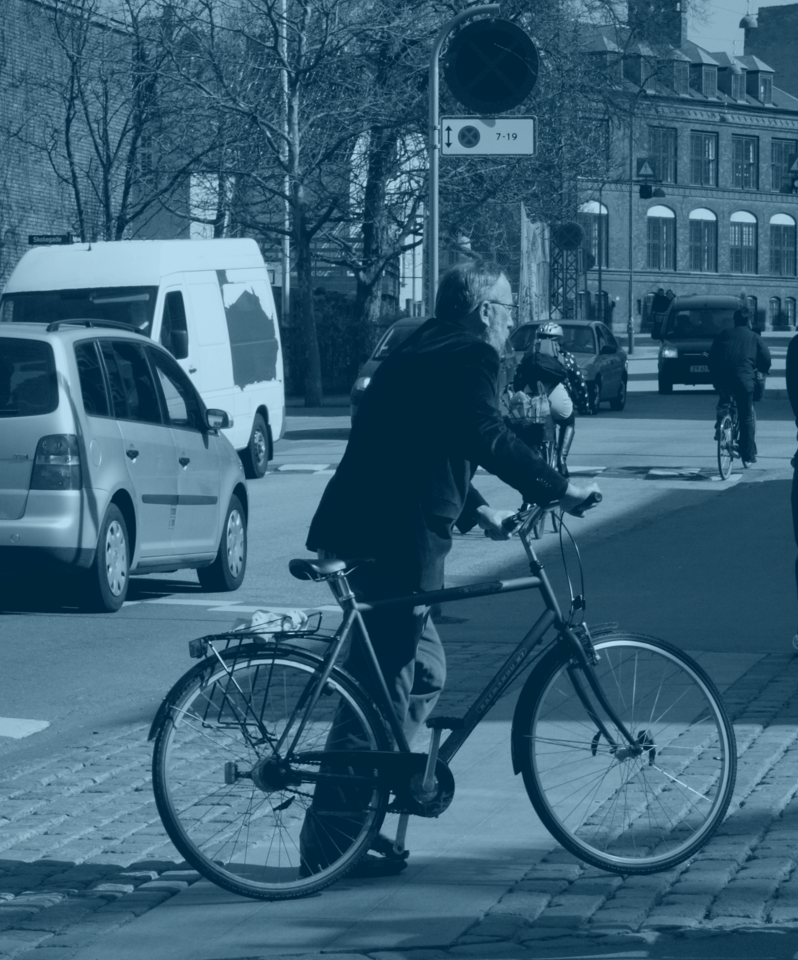
Nul-visionen skal komme alle til gode - cyklister, fodgængere, bilister og unge som ældre.