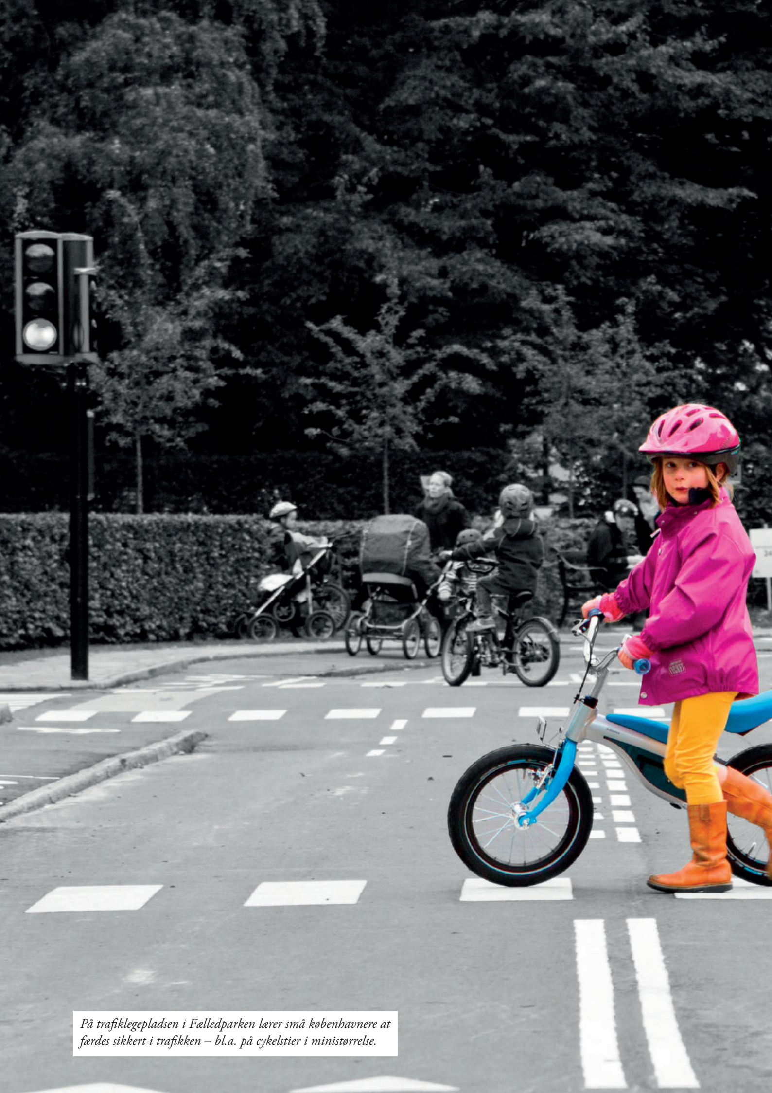
På trafiklegepladsen i Fælledparken lærer små københavnere at færdes sikkert i trafikken – bl.a. på cykelstier i ministørrelse.