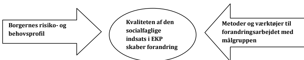
Figur 1. Kvaliteten af den socialfaglige indsats i EKP

Evalueringerne kan således ses som en naturlig forlængelse af ovenstående udviklingsbehov og er lavet med henblik på at få mere viden om implementeringen af en egentlig programbaseret indsats fra starten af 2012 og resultaterne af denne for borgerne, for løbende at kunne justere samarbejdet i enheden og forbedre udbyttet for borgerne. Den daglige udfordring for EKP og kunsten for vejlederne består således i at kunne matche vejledningen og udviklingsarbejdet til en differentieret og kompleks målgruppe hvis forhold kan ændre sig fra vejledningssamtale til vejledningssamtale.