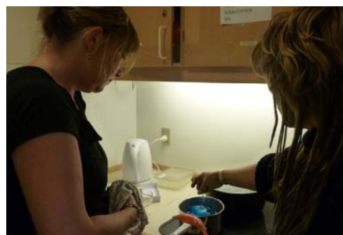
I kvindeklubben er der mange forskellige kreative aktiviteter på programmet - som f.eks. at lave sæbe.