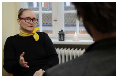
75 har haft samtaleforløb hos psykolog eller terapeut.