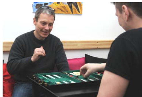
Hygge i caféen i København.