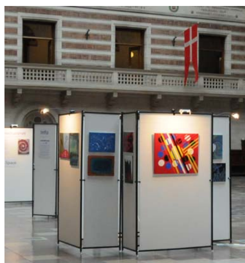
Mange indsatte deltager i Exits kunstprojekt, Export Kunst, som i september 2012 udstillede på Københavns Rådhus.