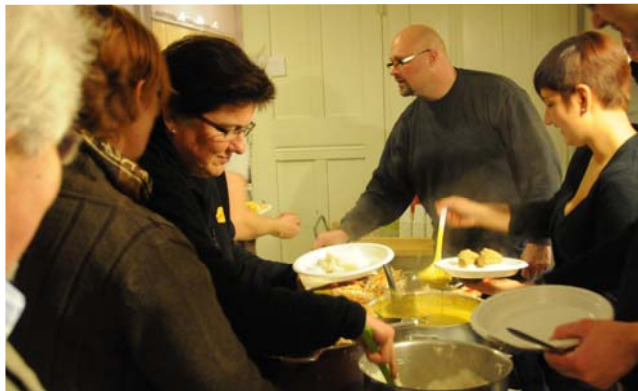
Hver måned holder Exit kultureftermiddage i Odense, Aarhus og København .