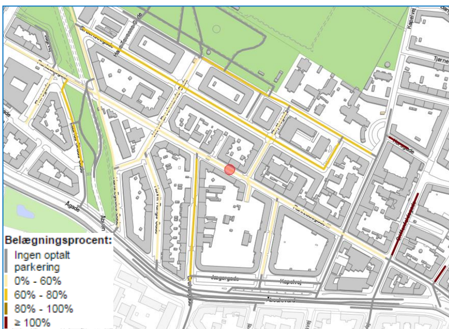
Kort # 1 viser belægningsgraden i projektområdet kl. 22