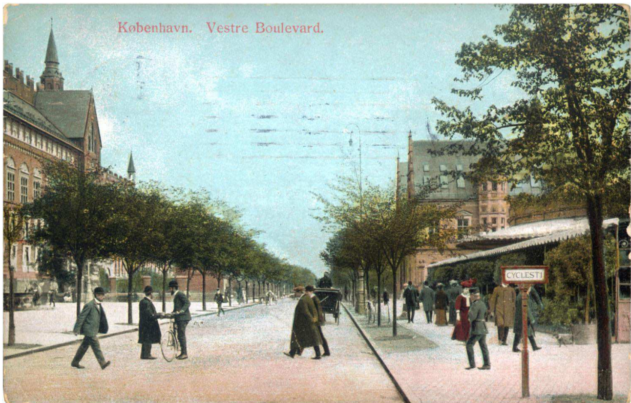
Tredje Natur skriver: »Postkort fra fremtiden? Liveability, grøn mobilitet og bynatur anno 1907. Vestre Boulevard (nu H. C. Andersens Boulevard).«

Come on, Copenhagen – lad os se en visionær plan for fremtidens cykelby!