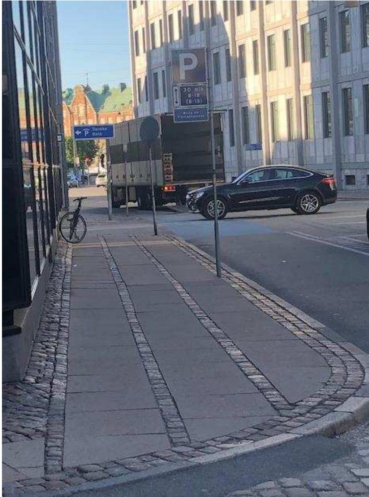
Billede 9: Lastbils ulovlige parkering midt på kørebanen på Bremerholm i forbindelse med varelevering til området.