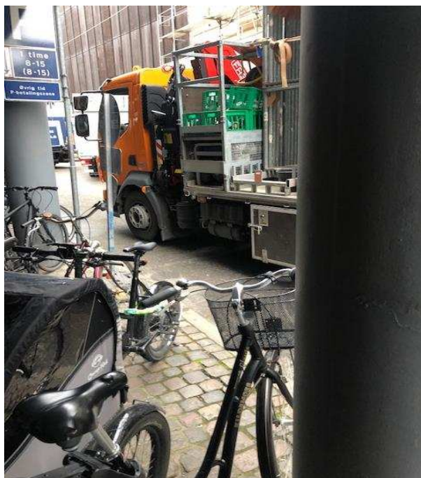
Billederne 14: Lastbiler i hobetal parkerer i køkaos på Vingårdstræde, der blokerer muligheden for at komme fra området. To chauffører er gået på gaden for at snakke. Det er umuligt at komme hverken frem eller tilbage.