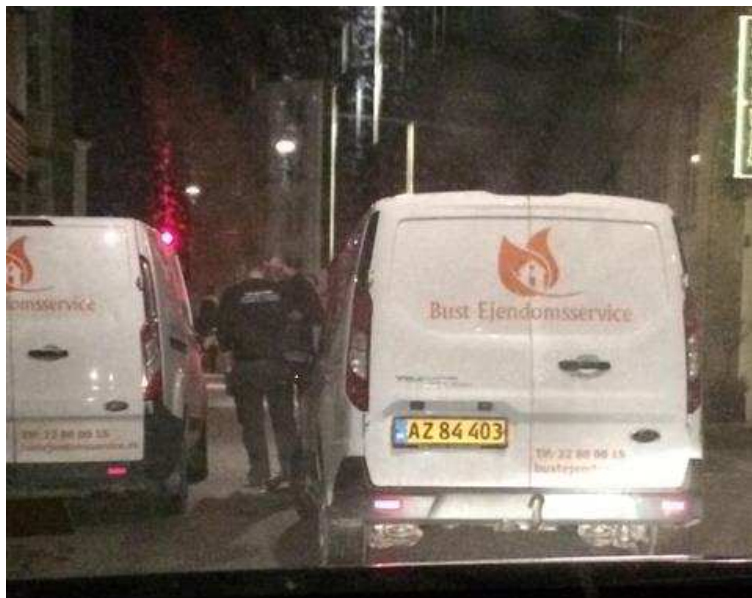
Billede 4: To servicevogne blokerer udkørslen fra området via Vingårdstræde mod Bremerholmen. Den ene af de to biler parkerer midt på kørebanen uden nogen former for respekt for medtrafikanter.