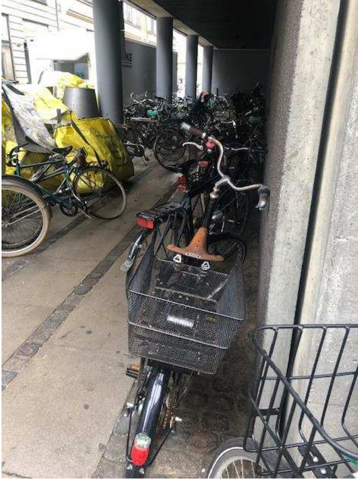
Billede 16: Cykler parkeret i kaos ved Danske Banks parkeringshus ved krydset mellem Asylgade og Vingårdstræde. Det er hverken muligt at komme frem eller tilbage.