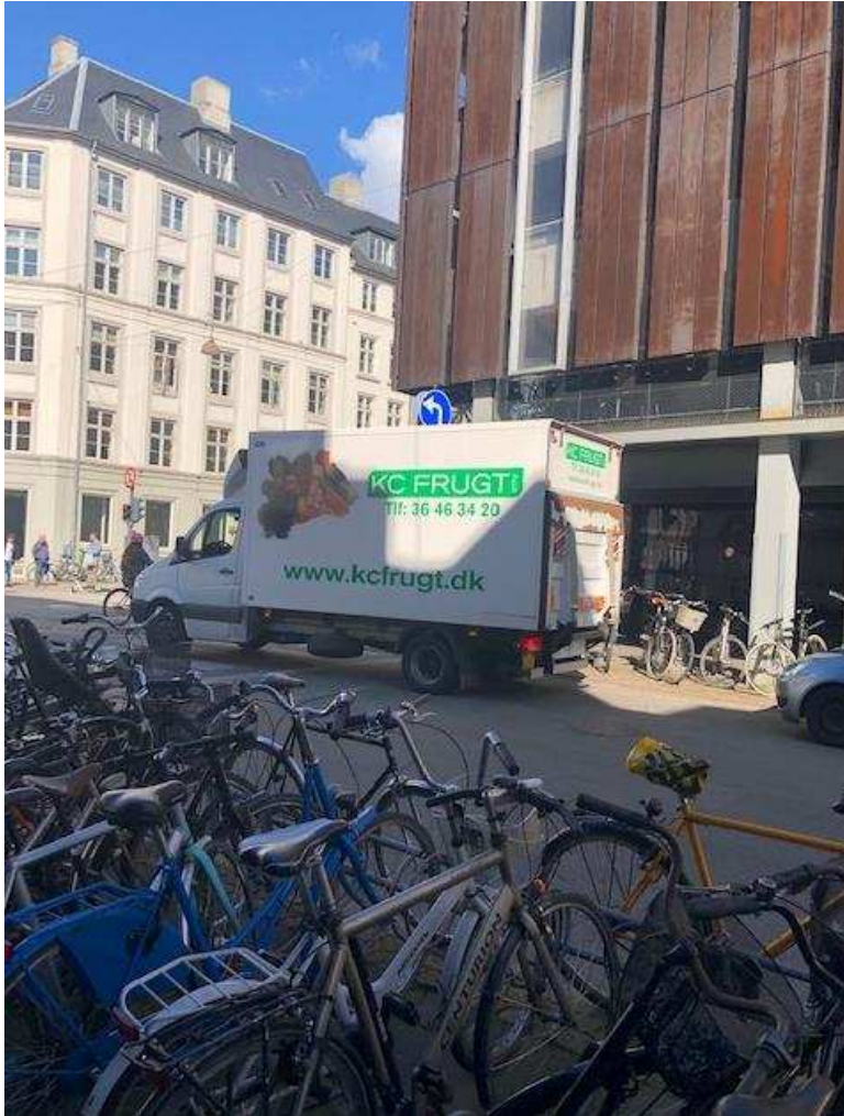
Billede 8: Lastbils ulovlige parkering ved krydset mellem Asylgade og Bremerholm i forbindelse med levering af varer til Magasin.