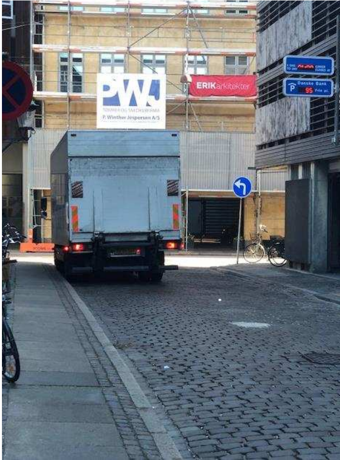
Billede 11: Lastbil parkere ulovligt på kørebanen før kl. 07.00 i tomgang i forbindelse med vareindlevering til Magasin.