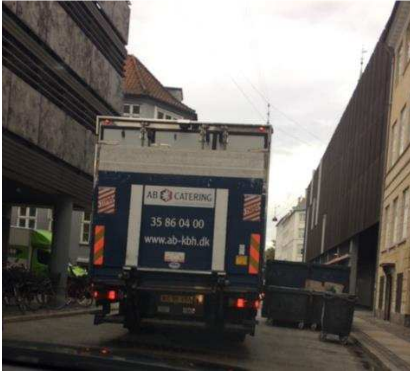
Billede 2: Lastbils parkering midt på kørebanen på grund af pladsmangel længere frem, ligesom der Magasin uden tilladelse af opstillet containere, der blokerer for udkørsel fra området. For enden af Asylgade har 3x34 bil med varer til Magasin deslige parkeret ulovligt.