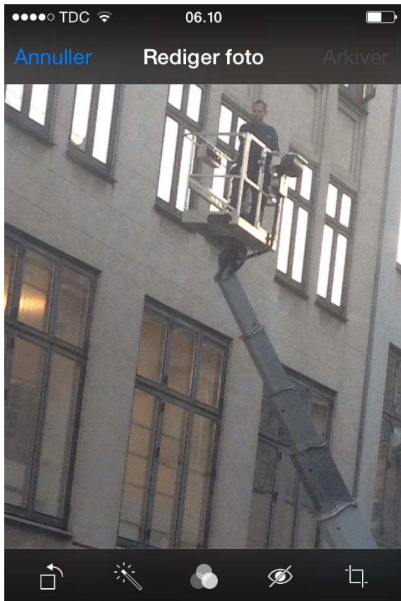
Billede 12: Magasin bygningen der kl. 06.10 om morgenen med højlydt larm fra lift, der anvendes ved pudsning af vinduer til store gener for de sovende beboere i området.