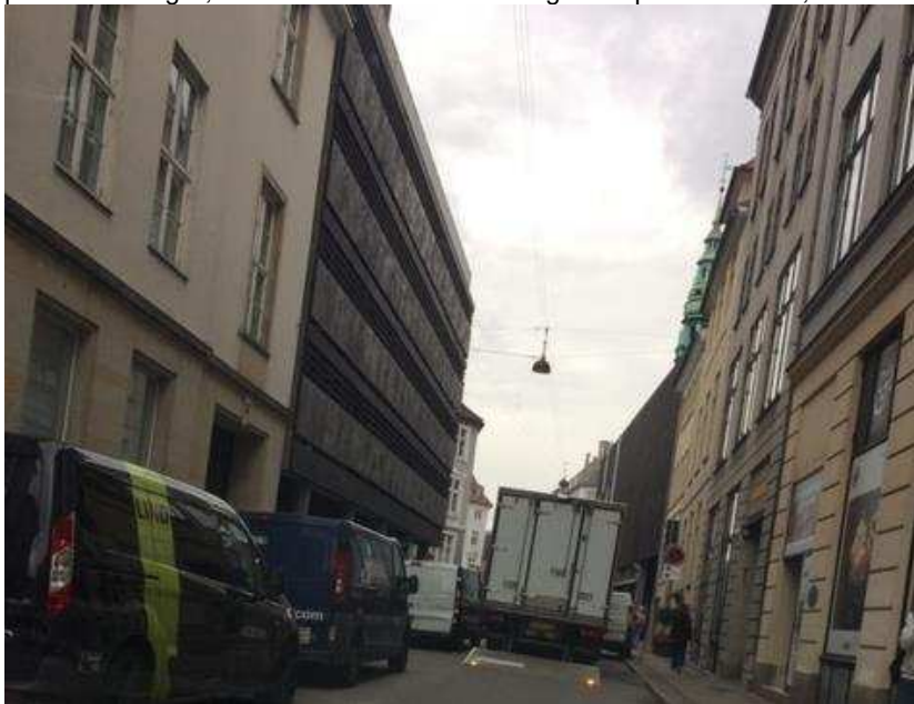
Billede 1: Lastbils aflæsning midt på kørebanen, der i længere tid blokerer for udkørsel fra området. Lastbilen er omgivet af mange varebiler, der blokerer for kørsel omkring.

Med forslaget til Lokalplanen vil antallet af varebiler, lastbiler og cykler i Lokalplansområdet stige væsentligt. Vedlagt er udsnit af fotodokumentation, der bekræfter de store og kaotiske trafikale problemstillinger, der allerede forefindes i dag Lokalplansområdet, hvilket er stærkt utilfredsstillende: