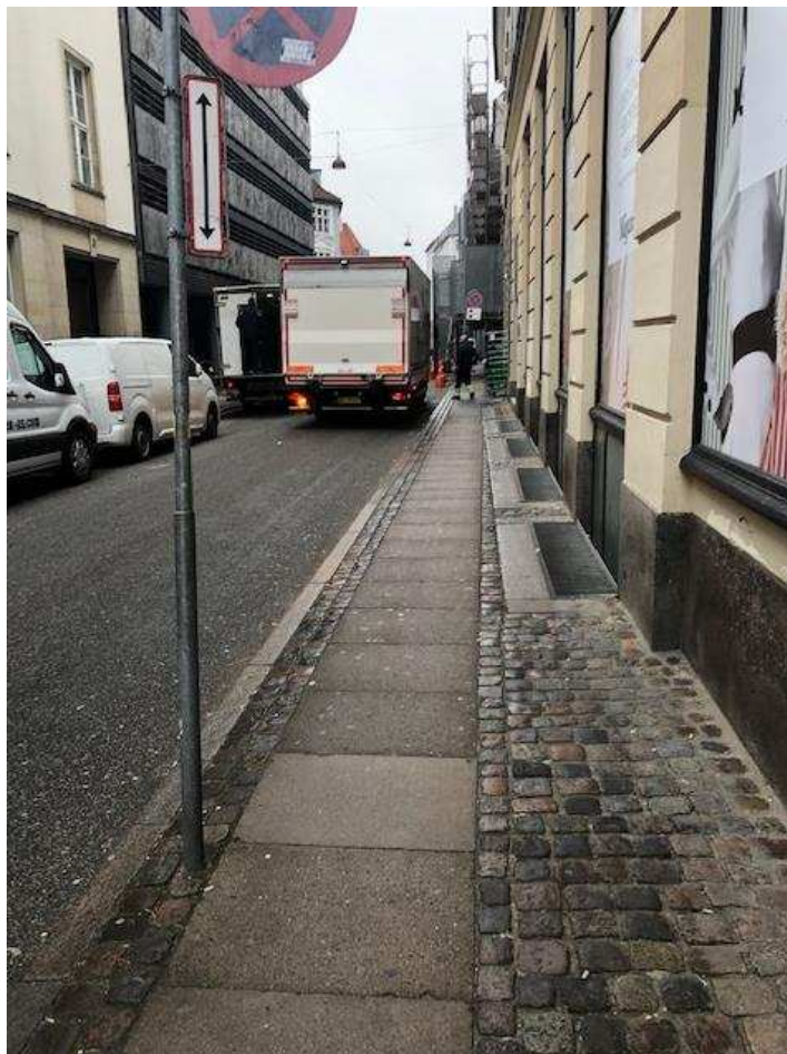
Billede 17: Lastbiler parkerer i kaos ved Magasins vareindlevering. Skiltningen bekræfter ulovligheden.

Afslutningsvist skal det understreges, at det vil være helt uacceptabelt , hvis Københavns Kommune på nogen tænkelig måde imødekommer Magasins ønske om, at der i byggeperioden eller i andre perioder skal kunne ske vareindlevering før kl. 07.00! Et sådan inhumant forslag understøtter den totale mangel på respekt fra Magasins side over for dennes naboer, der bor og lever i området og skal have en tålelig tilværelse!