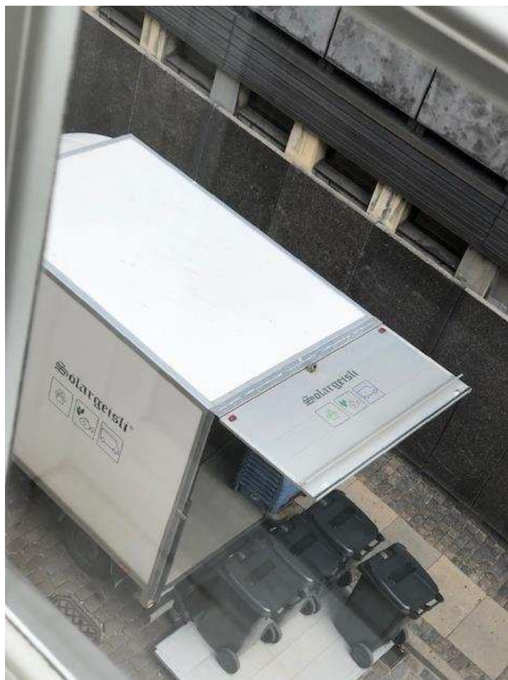
Billede 15: Lastbiler der dagligt parkerer ulovligt på Asylgade for at trække skraldespande og metalvogne henover brostenene.