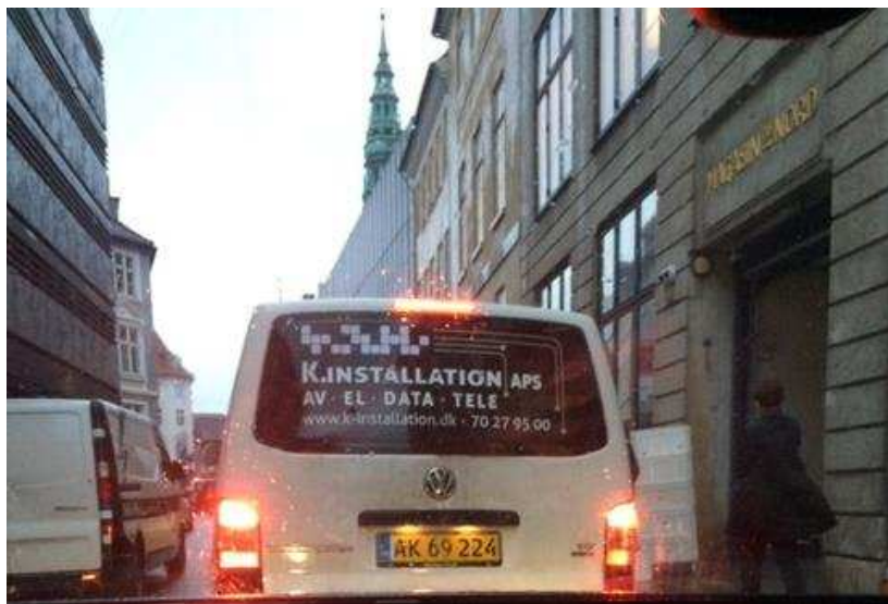
Billede 5: Blokering af udkørsel fra Vingårdstræde mod Bremerholm på grund af vareindleveringer til Magasin.