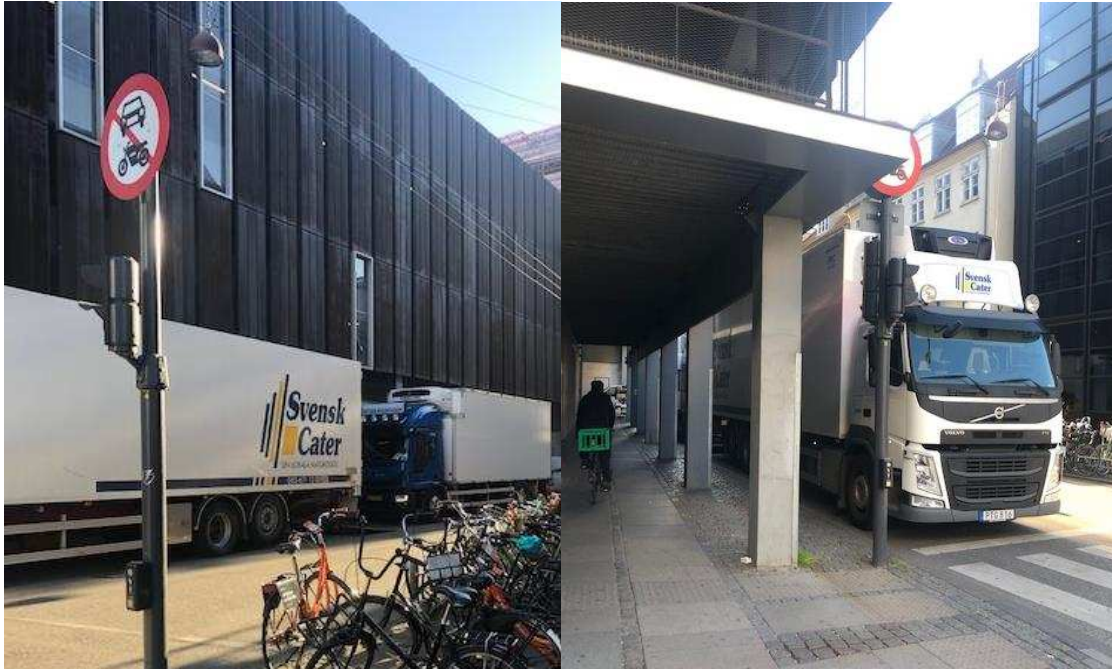
Billede 10: Lastbilernes vogntog ulovligt parkeret langs Magasin i Vingårdstræde i krydset.