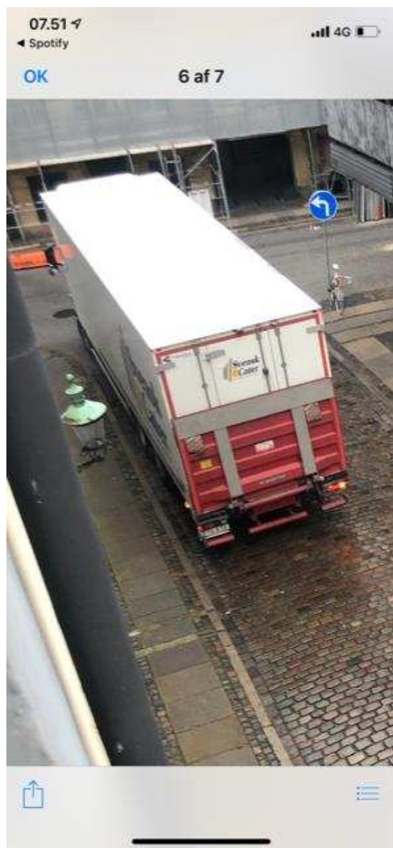
Billede 13: Lastbil parkerer ulovligt på kørebanen i tomgang i forbindelse med vareindlevering til Magasin.