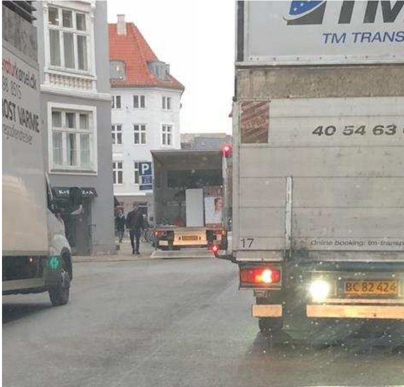
Billede 6: Lastbilers ulovlige parkering i forbindelse med levering af varer til Magasin.