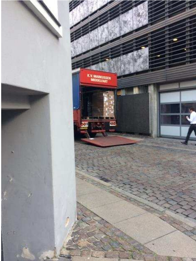
Billede 3: Lastbils ulovlige parkering i forbindelse med aflæsning af varer på Asylgade. Burene med varer trækkes henover de toppede brosten med store støjmæssige gener for beboerne.