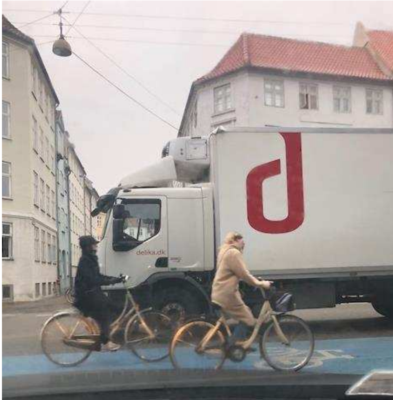
Billede 7: Lastbils ulovlige og respektløse parkering på Bremerholm, der spær vejbane, udsyn og udkørsel fra Dybenggade til Bremerholm i forbindelse med levering af varer til Magasin.