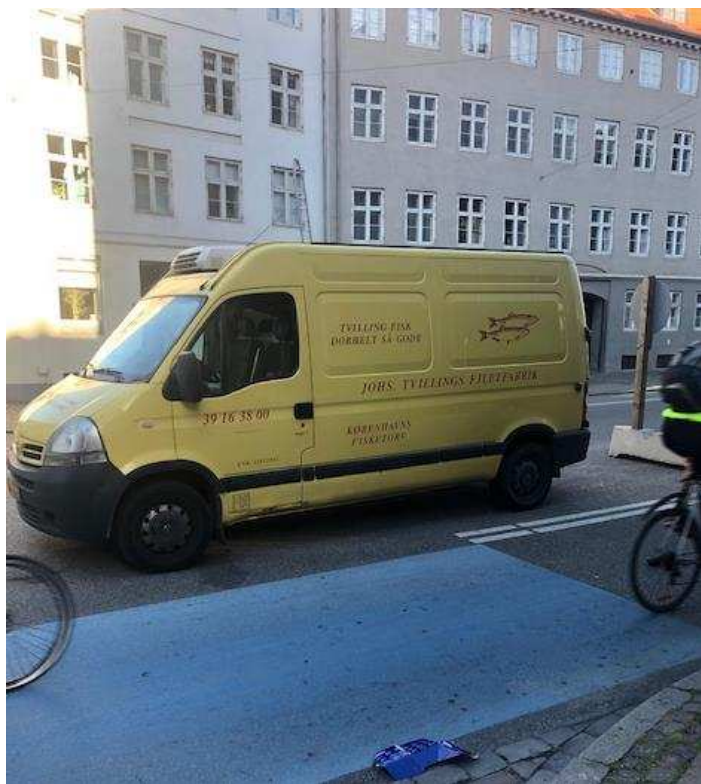
Billede 15: Varebiler der dagligt parkerer ulovligt på Bremerholm.