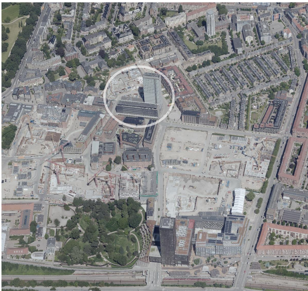
Carlsberg Byen set fra syd. Silo og forbygning ved Ny Carlsberg Vej markeret med cirkel

Bevaringsværdig bebyggelse der må nedrives sammen med lokalplanens byggefelt til nybyggeri (karré og højhus)