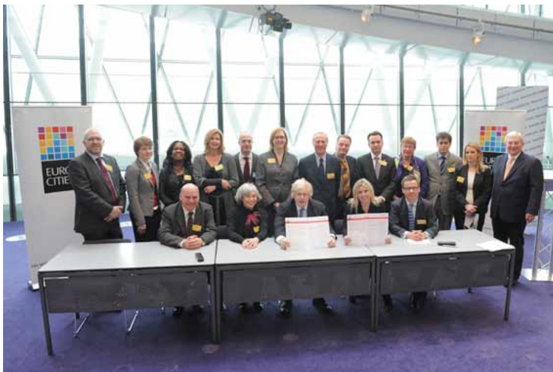
Underskrift af Eurocity Charter hos Lord Mayor Boris Johnson i London