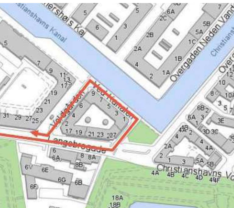
Christianshavns Borgerpanel 2022