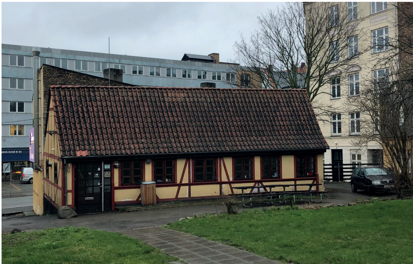
Smedjen, Valby Langgade 55, set fra gården.

Bygningen er ikke udpeget som bevaringsværdig, fordi den er brændt i 1987, og det alene den vestlige gavl, der står som originalt. Den resterende del af bygningen står ikke som oprindeligt. Bygningen er SAVE-registreret med værdien 6.