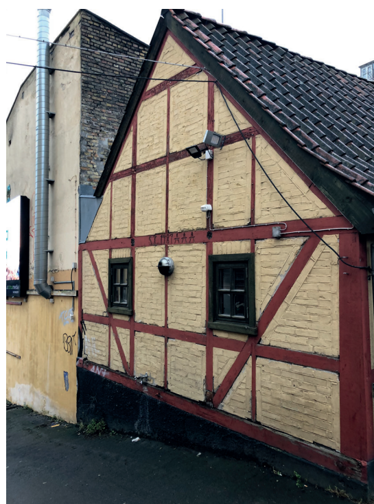
Den vestlige gavl mod passagen står som oprindeligt