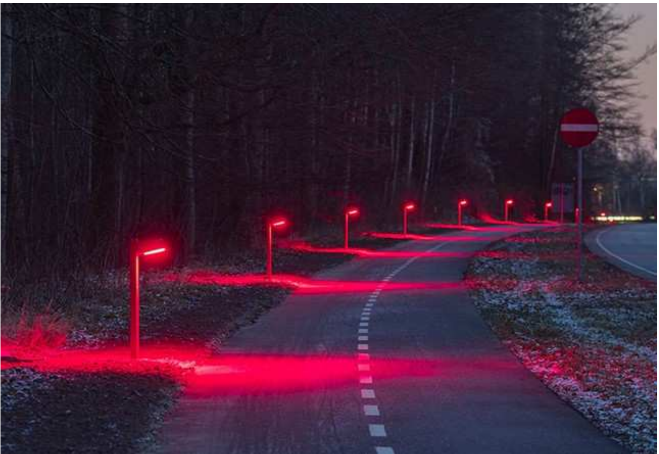
Referencebillede: Focus Lighting NYX pullert med rød belysning, opsat langs supercykelstien ved Skovbrynet Station (ved Frederiksborgvej) i Gladsaxe Kommune.