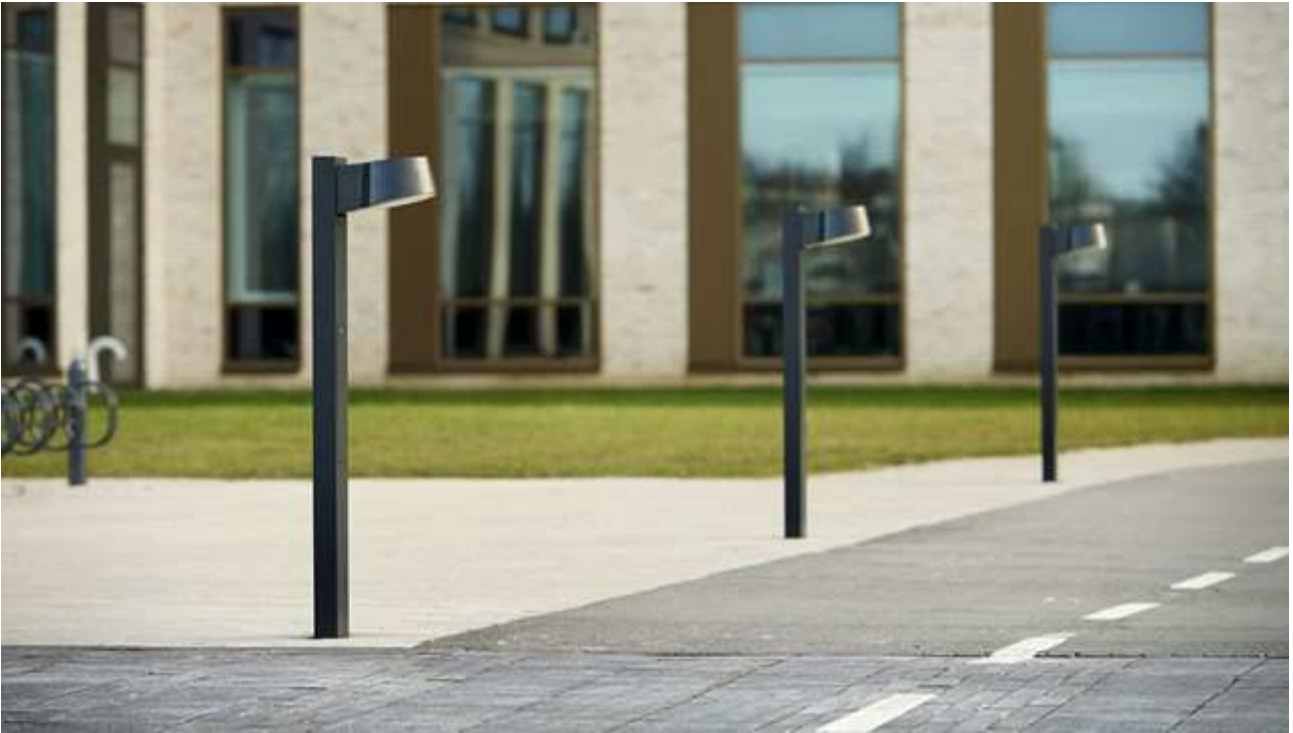
Referencebillede: Focus Lighting NYX pullert, set i dagslys ved Innovation Campus, Lundetofte