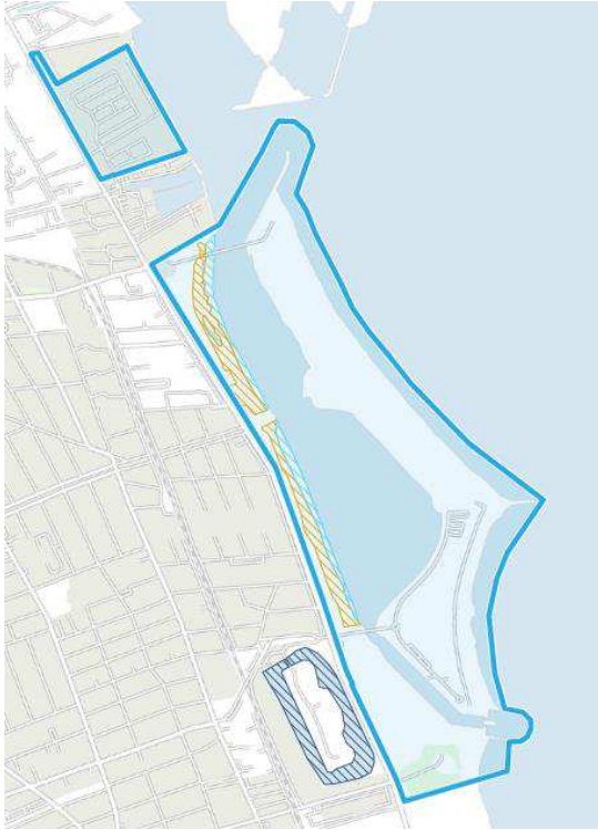
Fig. 1: § 3-kort fra Danmarks Arealinformation. Fredningsgrænsen for Amager Strandpark er angivet med blå streg. Naturtyperne strandeng (lyseblå skravering) og overdrev (orange skravering). Sø omkring Kastrup Fort (mørkeblå skravering) er udenfor fredningsgrænsen.

Ved Kastrup Fortet findes en søbeskyttelseslinje og fortidsmindebeskyttelseslinje, der rækker ind i planområdet, nærmere bestemt delområde 1b og 3a (se fig. 2). Indenfor begge beskyttelseslinjer er der et generelt forbud mod tilstandsændringer, men dette tillæg til udviklingsplanen for Amager Strandpark muliggør brugen af afbrænding uden forudgående dispensation fra disse, jf. fredningens § 11. Skal afbrænding foretages på de § 3 udpegede områder, skal der søges om dispensation til dette, jf. Naturbeskyttelsesloven.