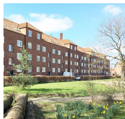
Stokbebyggelse syd for Frederikssundsvej, Husum Park fra 50'erne, Rød tegl med saddeltag og kviste.