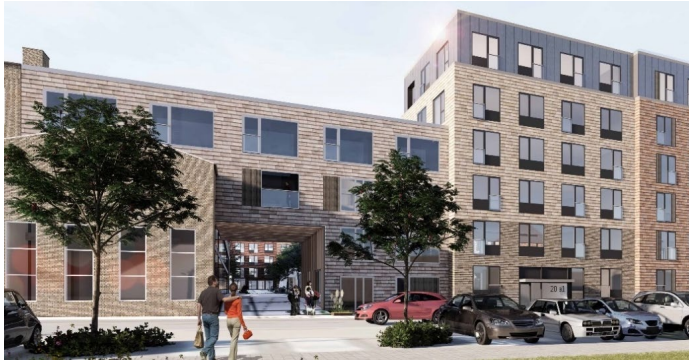
Visualisering før Facade mod Gadelandet.