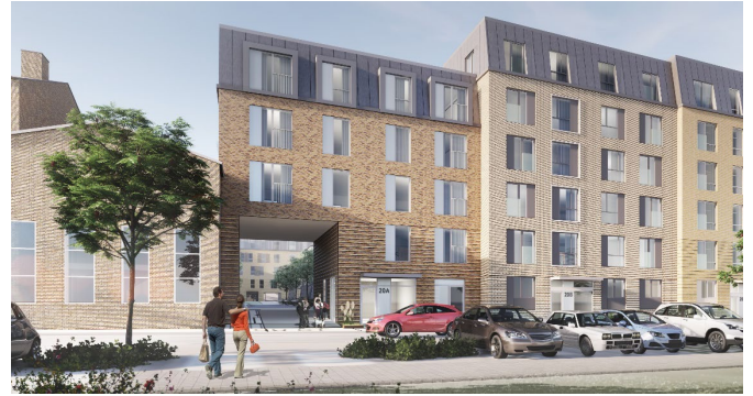
Visualisering nu Facade mod Gadelandet, Traditionelt tegl bidrager fint til sammenhængen mellem de gule volumener, der er arbejdet med facader og en skrå tagafslutning som samler karrémotivet.