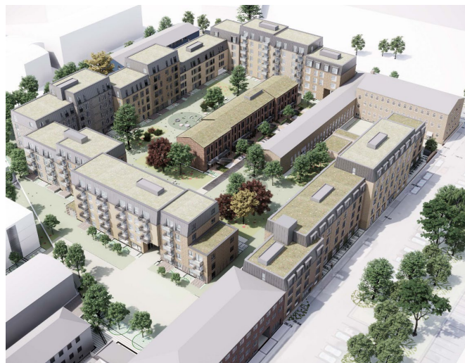
Visualisering nu Oversigt fra syd øst. Alle øverste etager får en skrå afslutning og alle tage begrønnes, også saddeltag på rækkehusene midt i haverummet, så at dette indgår i et sammenhængende grønt indtryk.