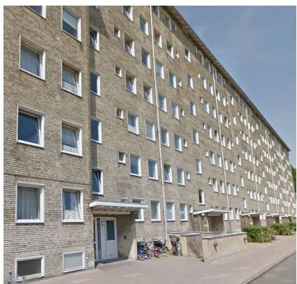
Voldparken stokbebyggelse fra 50'erne, med gule tegl med helt rytmiske kvadratiske vinduessætning.