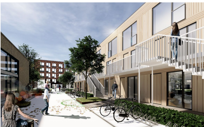
Visualisering før Passage langs Kranhal og rækkehuse, set mod syd.