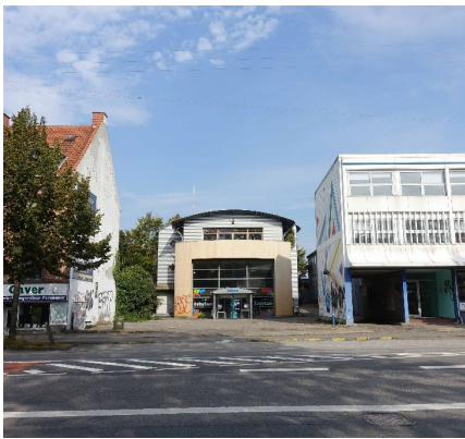
Erhverv mod Frederikssundsvej i hvid plade/malet beton Nabobygning nr. 276 som beige puds og sinusplade. Tagformer er flade, tøndehvælv med tagafslutning øverst