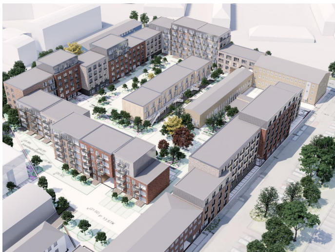
Visualisering før Oversigt fra syd øst.

Alle boliger får en tagetage markeret med en skrå tagflade, med et andet materiale end murværket under. Rækkehuse gives en tagrejsning på 20°, med tagbegrønning som er synlig fra Karréen ned i haverummet.