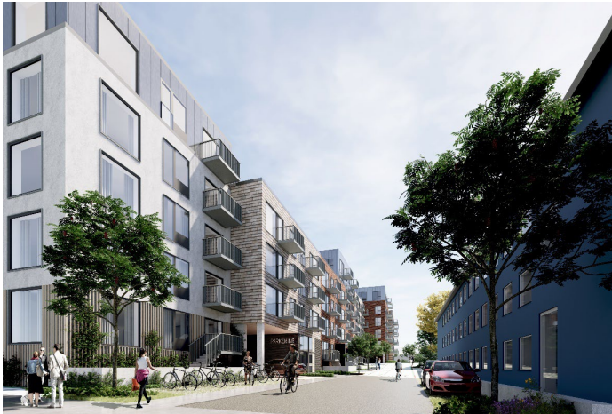
Visualisering før Passage langs Gadelandet 18