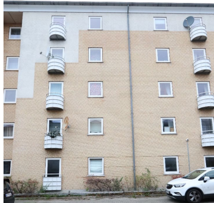
Husumgård, gul tegl med hvide balkoner. Topafslutning mod tag er gennemgående for Karrédelen