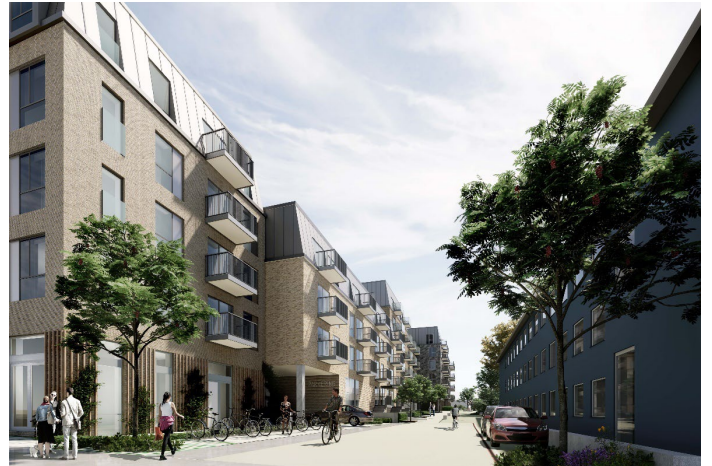
Visualisering nu Hjørnehuset mod nord, fremstår mere afdæmpet med skrå tagflade. Hjørnet i stueplan er ændret til fælleslokale, der "lander" meget bedre og åbnes op på hjørnet, i stedet for en lidt udsat stuebolig. Gråt murværk udgår.