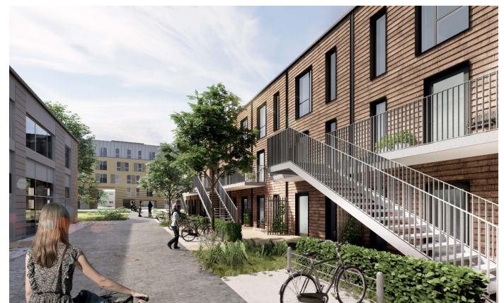
Visualisering nu Passagen langs kranhallen mod syd. Facader på rækkehuse tegnes med vertikale opdelinger, så at de fremstår som rækkehuse med en fin rytme og aftegning af den indre opdeling. Husene gives et begrønnet sadeltag.