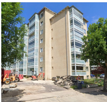
Voldparken stokbebyggelse fra 50'erne, nyrenoveret med skærmede altaner.