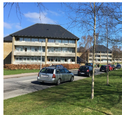
Voldparken fra 50'erne, gule tegl med en valmet saddeltags løsning.