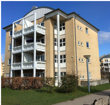
Husumgård fra 90'erne, punkthuse i gul tegl med hvide altaner og søjler tagformer er tøndehvælv.

Tagformer er tøndehvælv med topafslutning, lav rejsning på 18° og saddeltag. Materialer er udpræget gult murværk med hvide detaljer, materialeskift sker ved Frederikssundsvej.