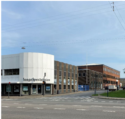
Hjørnet mod Frederikssundsvej fremstår i røde og brune tegl, samt hvid plade/malet beton. Taghældning er 18° eller fladt tag

De fleste tagformer er flade eller med 18° taghældning Materialer varierer mellem gule, brune, røde tegl samt farvet puds.