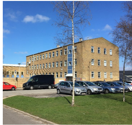
Kobbelvænget 72, samt kranhallen bagved fremstår i gule tegl Med en taghældning på 18°