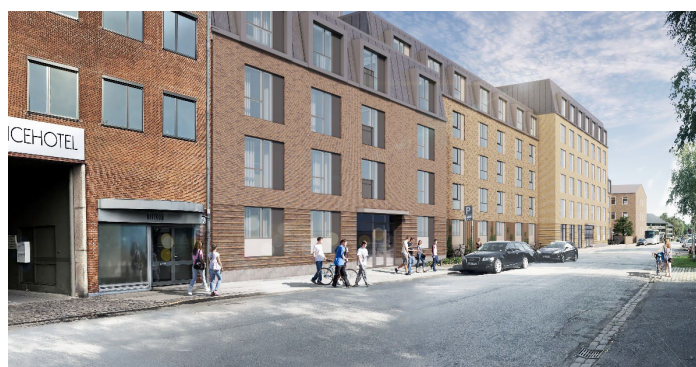
Visualisering nu Projektet i Kobbelvænget set fra sydøst. De øverste etager er vist med en skrå tagflade og er markeret yderligere med karnapper der giver en bedre detaljering. Traditionelt murværk passer fint ind i eksisterende kontekst.