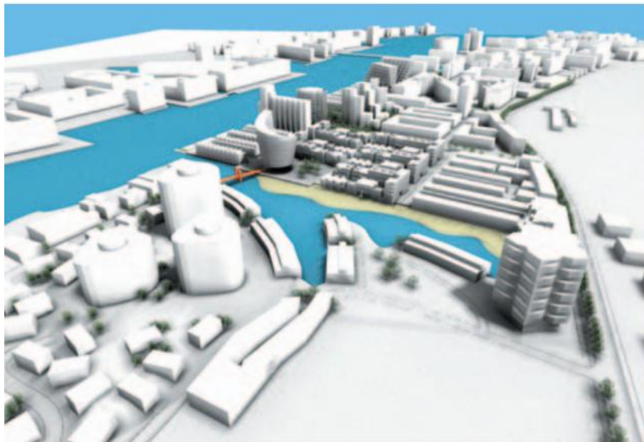
Figur 1 Lokalplanområdet Artillerivej Syd

Af lokalplanen fremgår det at følgende matrikler er omfattet: