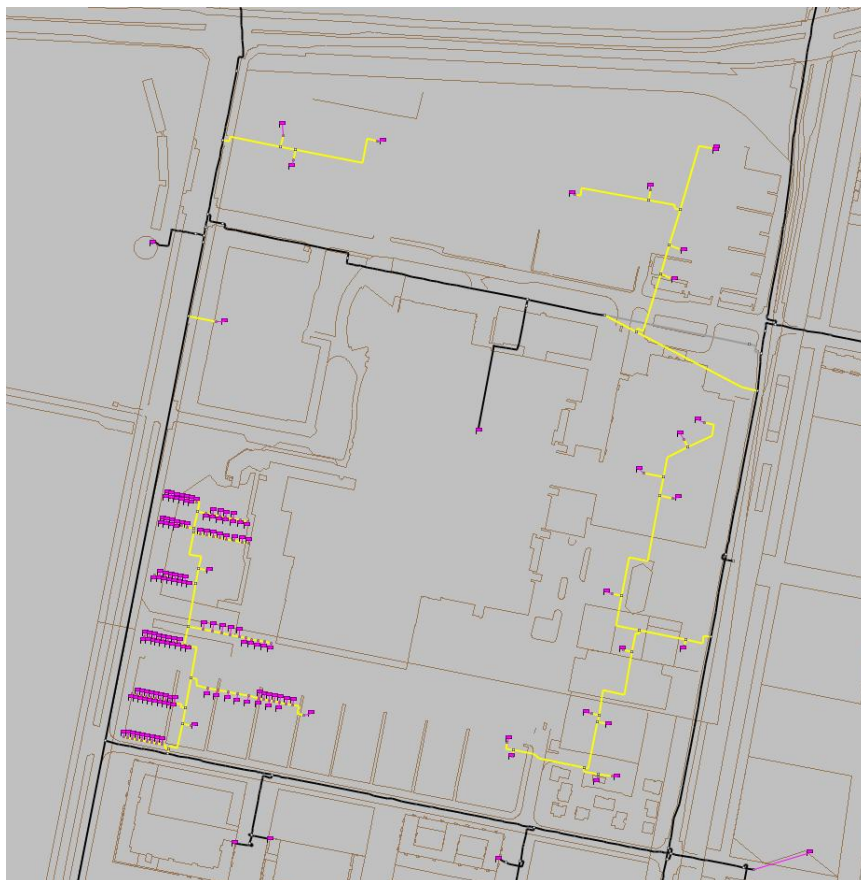
Figur 3 Udbygget ledningsnet for Kvarteret ved Bella Center