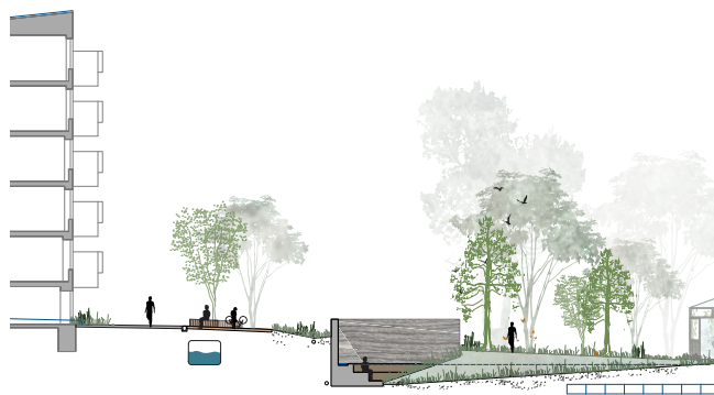
Princip for regnvandshåndtering i Engrotunden

Tagvand og overfladevand forsinkes og håndteres lokalt i gårdhaven. Det er målet at aflede og forsinke alt regnvand, der falder på matriklen op til en 100 års hændelse. På den måde aflastes kloaksystemet, så der undgås oversvømmelser og opstuvning af vand i kloak og kældre ved skybrud. Regnvandet fra AB Storgårdens tag føres igennem bygningen i rør to steder og ledes til en vandtank. Vandet renses og anvendes til vandtrappen, cykelvask og til drypvanding i orangeriet. Fra vandtanken er der overløb til forsinkelse på terræn i en lavning ved Engrotunden og i en underjordisk faskine. Det kan forventes, at regnvandet vil være synligt på græsarealet cirka en engang om måneden i op til 24 timer.