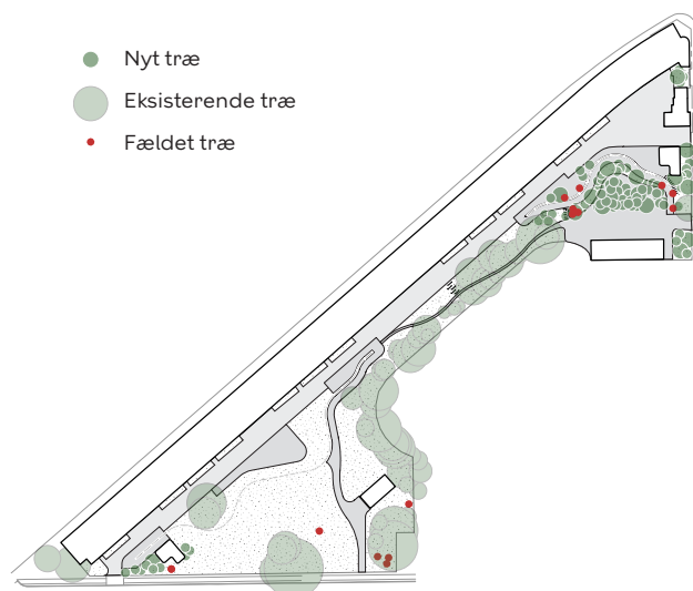
Diagram over eksisterende træer der bevares, fældes og plantes

I hver ende af gårdhaven, tæt ved portene, etableres standpladser til afhentning af dagrenovation fra affaldsskakte samt skure med sedumtag til