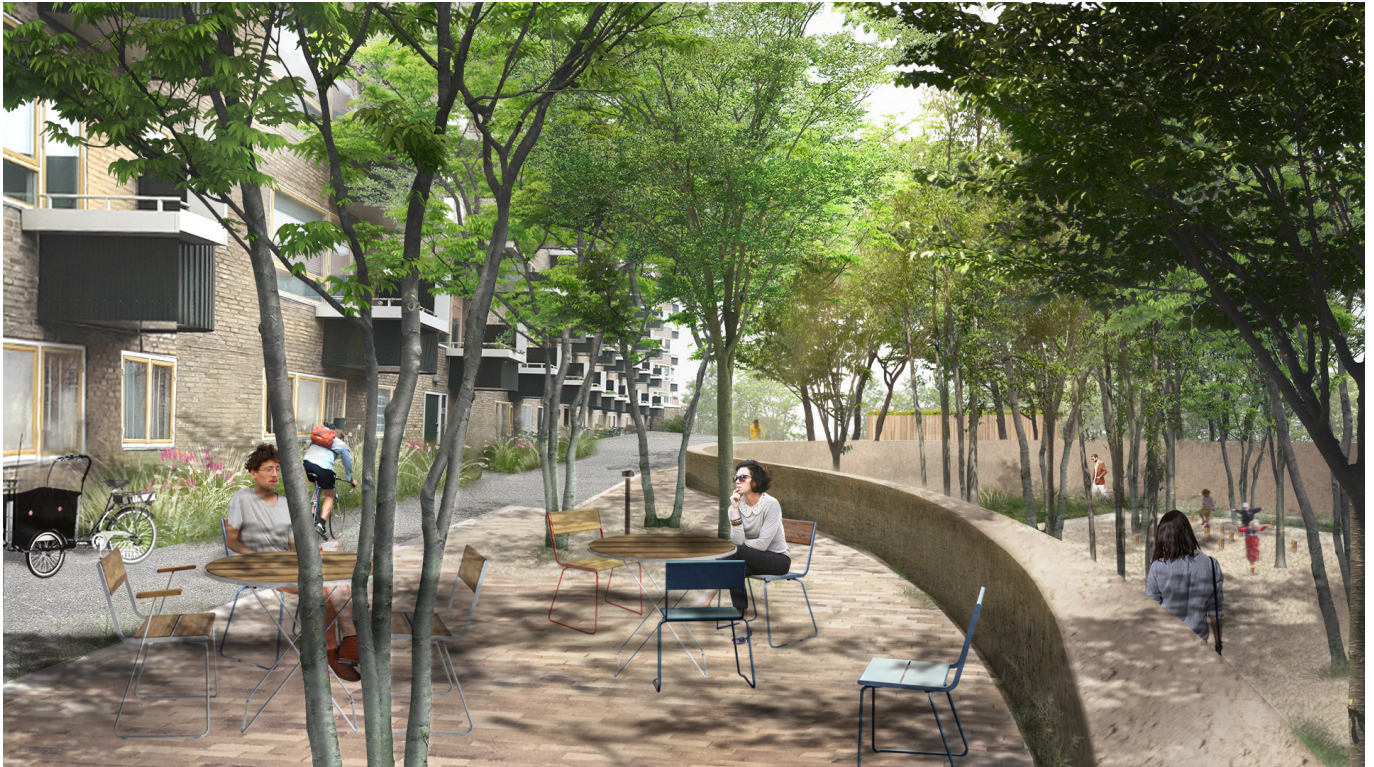
Visualisering af promenade med udkig til lunden i skovrotunden.