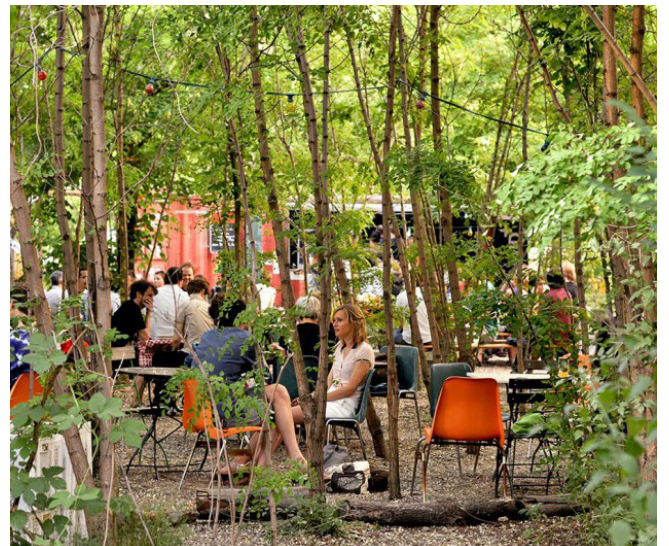
Eksempel på stammeskov