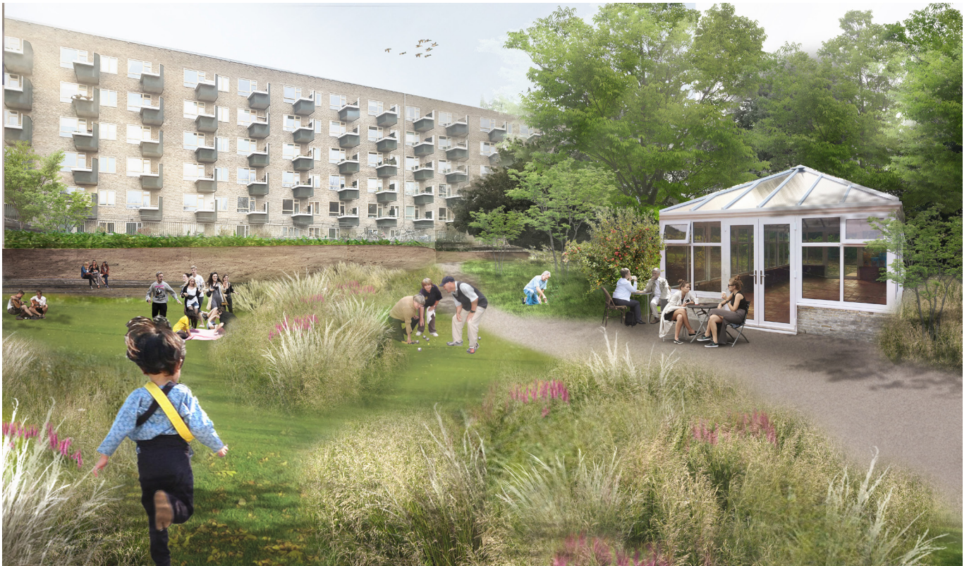
Visualisering af gårdhavens åbne eng set fra Hovemestervej.

mio. kr., der er afsat til projektet. Hofor betaler ca. 5 mio. til håndtering af regn- og skybrudsvand. AB Storgården finansierer bl.a. orangeri, p-pladser og møblering.