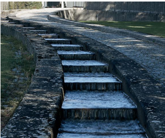
Eksempel på vandtrappe