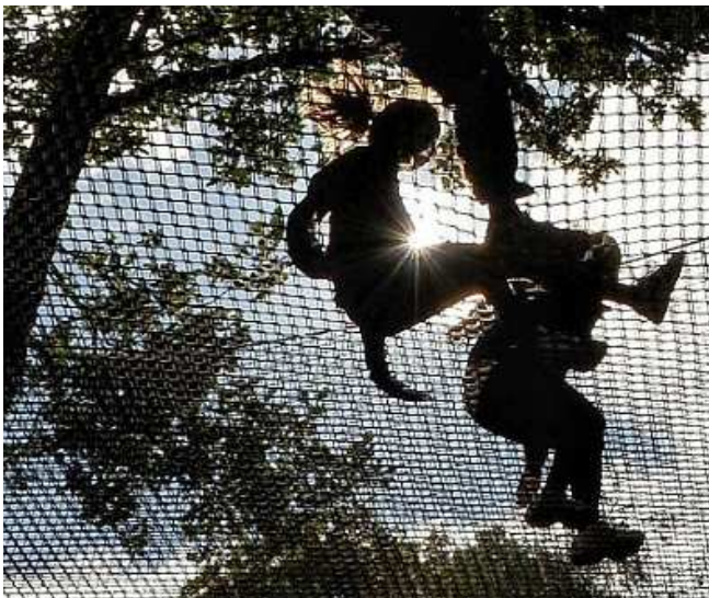
Eksempel på klatretet