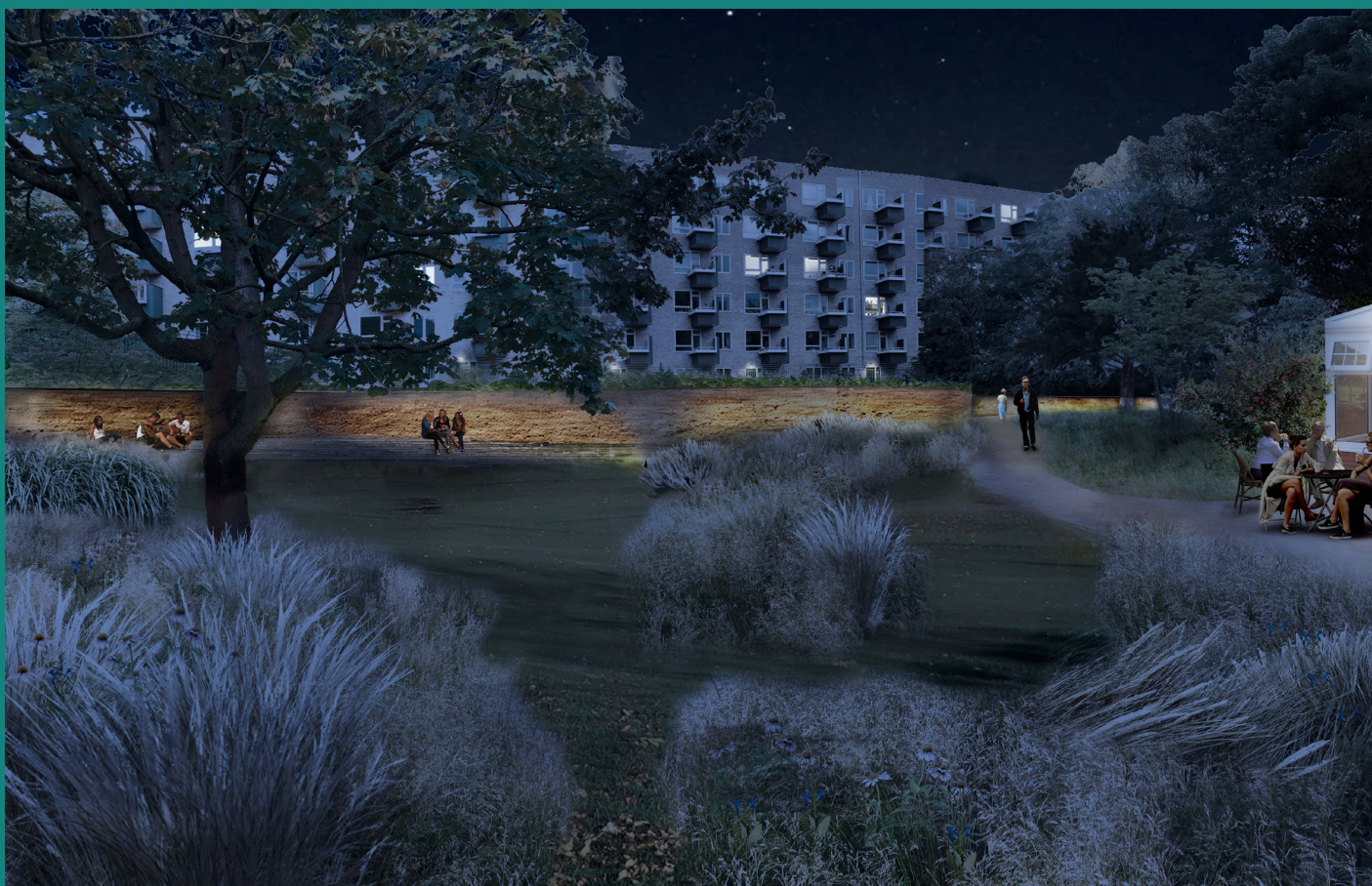
Visualisering af gårdhavens åbne eng ved aftenid.