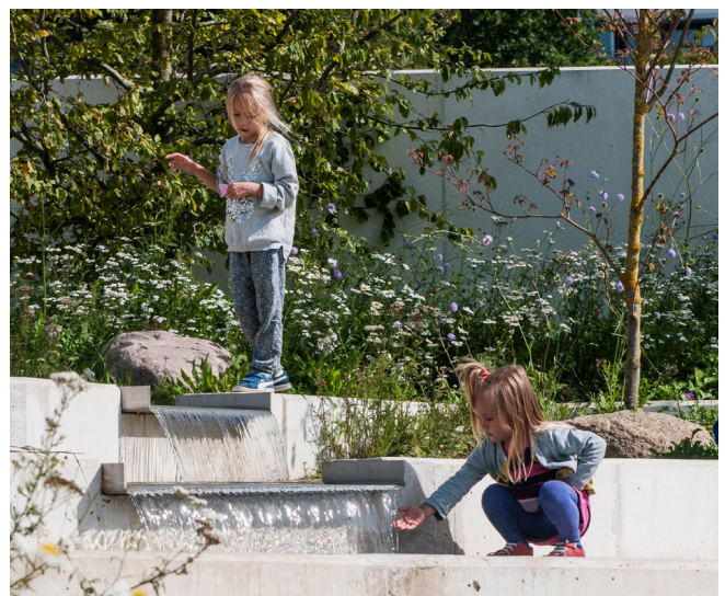
Eksempel på vandleg